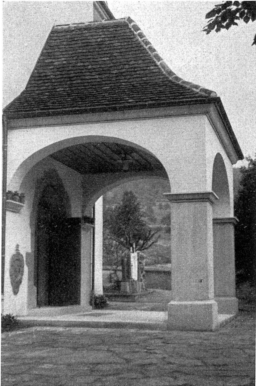
Michealskirche Wegenstetten. Neues Vorzeichen.

Werken nach Möglichkeit selbständig blieb und stets das Schönste anstrebt, gestattet uns, den Erbauer der Kirche zu St. Michael in Wegenstetten zu den grossen Meistern eines grossen Jahrhunderts zu zählen.