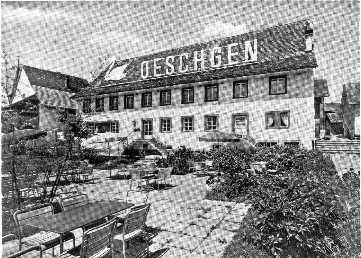
Neues Gasthaus zum «Schwanen»

licher Stunde, selten wohl auch der Donnermacher mit seinem Riesenblech hinter der wackelnden Kulisse. Und die Zuschauer weinten und lachten in unmittelbarer Nähe der Bühnenbretter mit. Zwischen Ofen und beiseite geschobenen Kulissen nahm nach dem Happy-End des Dramas die Ländlerkapelle ihre übermütige Tätigkeit auf, denn was wäre schon ein Dorftheater ohne die turbulentesten Läufe der Klarinette und das langhindauernde Tanzgewoge!