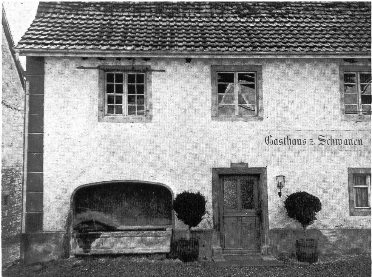
Altes Gasthaus zum «Schwanen»

Als Wandschmuck ziert die Gaststube des «Schwanen» in Oeschgen eine Kopie des Tavernenrechts, das der Freiherr Franz Otto von Schönau als Herr zu Oeschgen dem Dorfbürger Fridolin Hauswirth am 26. Januar 1725 verlieh. Diese Urkunde beginnt mit einer Art stolzer Präsentation des Dorf-