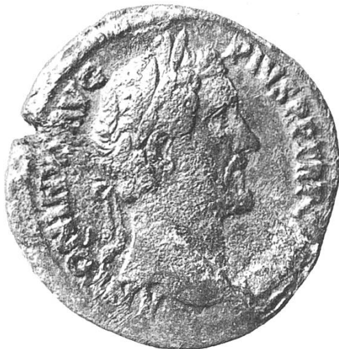
Vorderseite: Antoninus Pius (138–161)