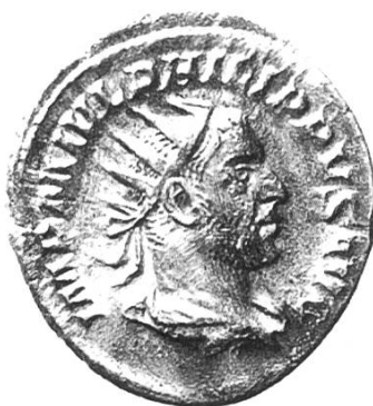
Vorderseite: Philippus I. (Arabs) (244–249)