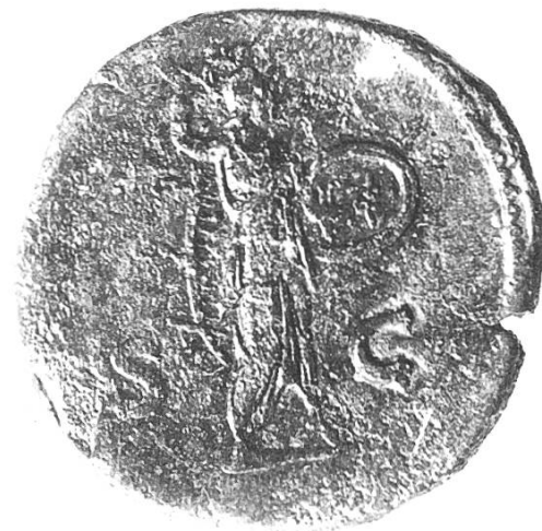
Rückseite: Minerva (Göttin des Verstandes) mit erhobener Lanze und Schild