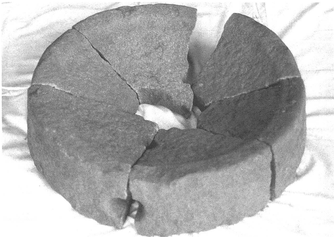
Abb. 5: Der obere Mahlstein der Handmühle, welcher einen Durchmesser von 42 cm besitzt. Das runde Loch in der Mitte diente zum Einführen eines Holzstabes, mit dem der obere Stein auf dem unteren gedreht wurde.