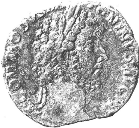
Vorderseite: Commodus (180–192)