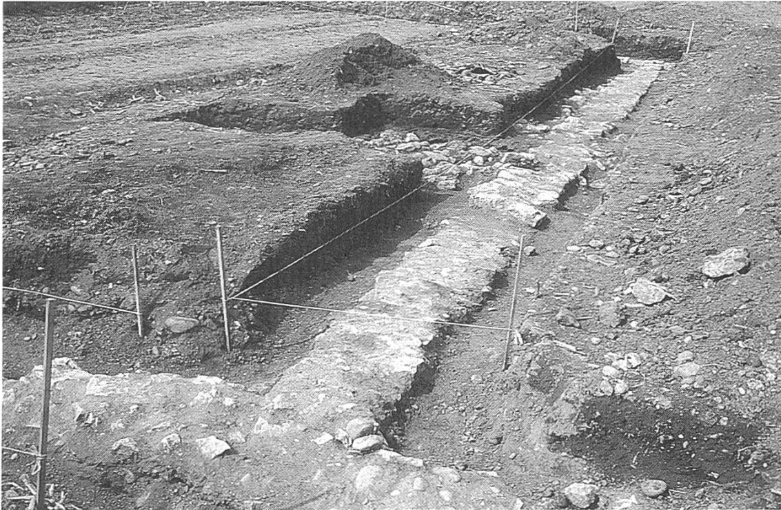
Abb. 2: Die zuerst freigelegte Nordmauer des Wirtschaftsgebäudes.