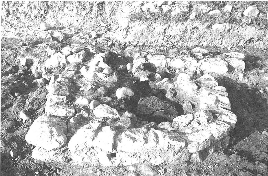
Abb. 3: Ein an die Innenseite der Nordmauer angelehnter halbrunder Bau, dessen Funktion noch nicht bestimmt werden konnte. Seine genaue Lage ist auf Abb. 2 schon ersichtlich.