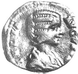
Vorderseite: Julia Domna, Frau des Septimius Severus (193–211)