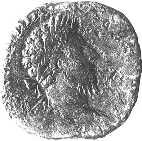
Vorderseite: Marc Aurel (161–180)