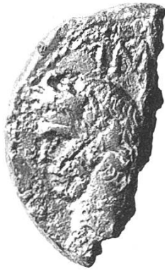
Vorderseite: Augustus (31 v. Chr. – 14 n. Chr.)