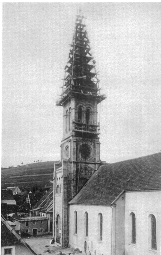
Gerüst von Robert Schmid an der Kirche von Radolfzell (Deutschland)

Es bildet ein Talent sich in der Stille, Sich ein Charakter in dem Strom der Zeit. Goethe