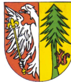
Neustadt im Schwarzwald.