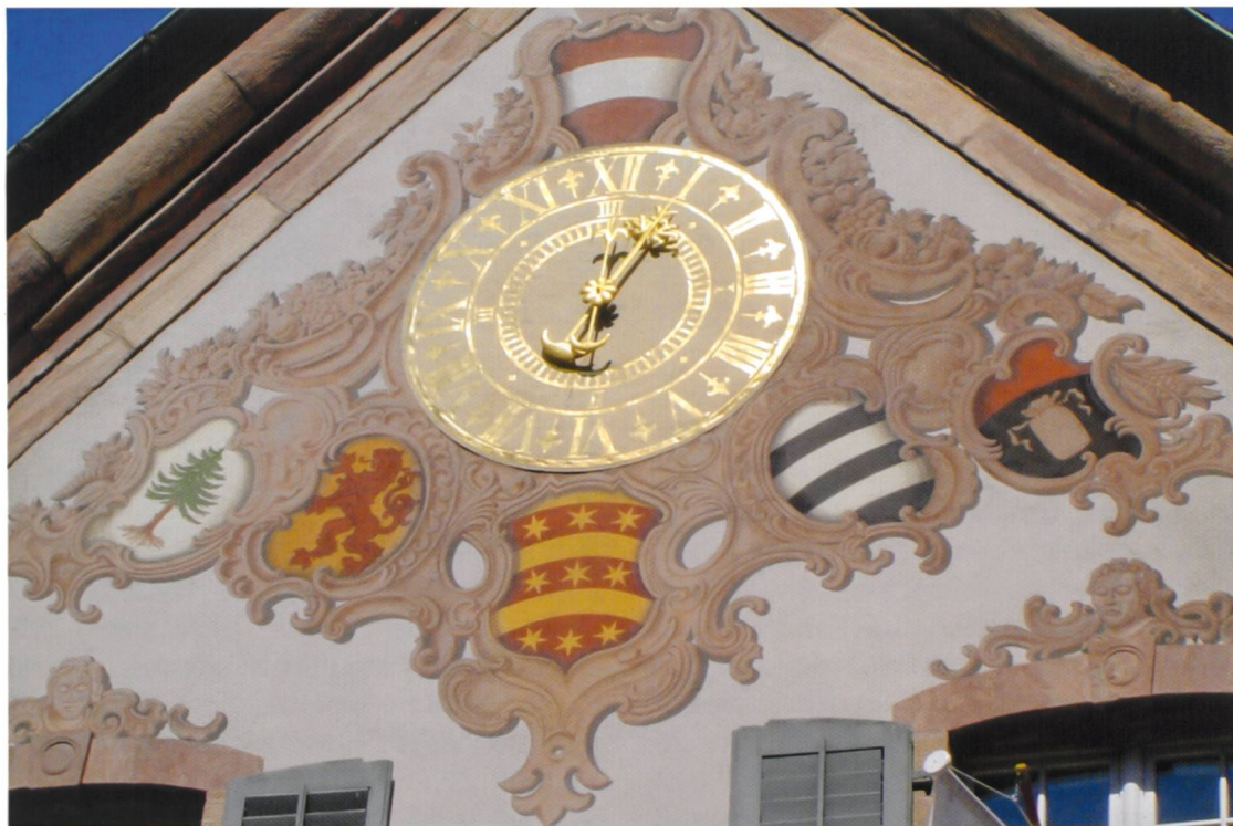
Giebelfeld am Rheinfelder Rathaus. Links das Wappen der Grafschaft Hauenstein.

den Wappen der Waldstädte Laufenburg und Säkingen nicht das Wappen der Stadt Waldshut, sondern dasjenige der Grafschaft Hauenstein (Tanne) angeführt ist.» 9