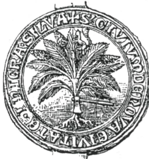
Neustadt im Schwarzwald, Siegel von 1454.