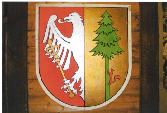
Wappen von Görwihl.

Das Wappen auf dem ersten Bild zeigt «in Silber auf grünem Schildfuß zwei grüne Tannen zwischen ihnen schwebend der österreichische Bindenschild». 1 Es befindet sich am ehemaligen Rotzler Rathaus. Das Wappen war vom Generallandesarchiv entworfen und von der Gemeinde seit 1907 geführt worden.