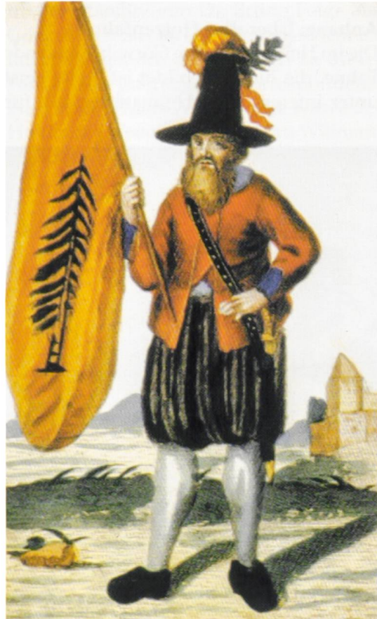
Hauensteiner Landfahnen. Kupferstich von Martin Engelbrecht, 1742.

gend notwendig ist, weil wohl bei einer Palme arg fehl am Platze. Ja, die Siegelstecher!» (Rüdiger F. Dreyhaupt in einem Brief an mich vom 17. Dezember 2008). «[...] Die Heraldik kennt keine Unterscheidung zwischen Tanne und Fichte oder gar