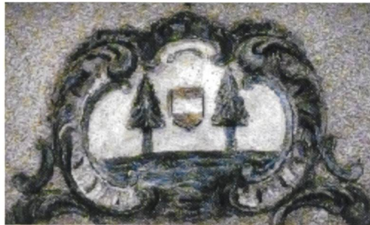
Wappen von Rotzel.