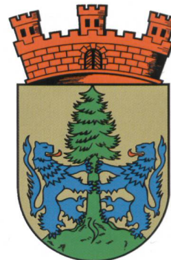
Wappen von Auma (Thüringen).