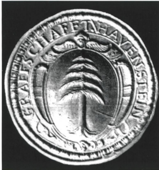
Siegel der Grafschaft Hauenstein von 1666.

Ein Siegel war gleichsam Ausdruck der Selbstverwaltungskörperschaft der Einungen auf dem Wald. So wie von alters her jeder Verwaltungs- und Rechtsvorgang in den Städten und auf dem Lande mit Unterschrift(en) und Siegel gültig wurde, so haben wir das Siegel der K. K. Kameralherrschaft der Grafschaft Hauenstein Waldvogteiamtlichen Bezirks als Ausdruck der verwaltungstechnischen Selbststän-