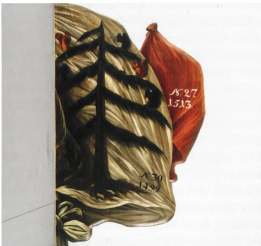
Wandbild des Hauensteiner Banners im ehemaligen Franziskanerkloster Luzern.