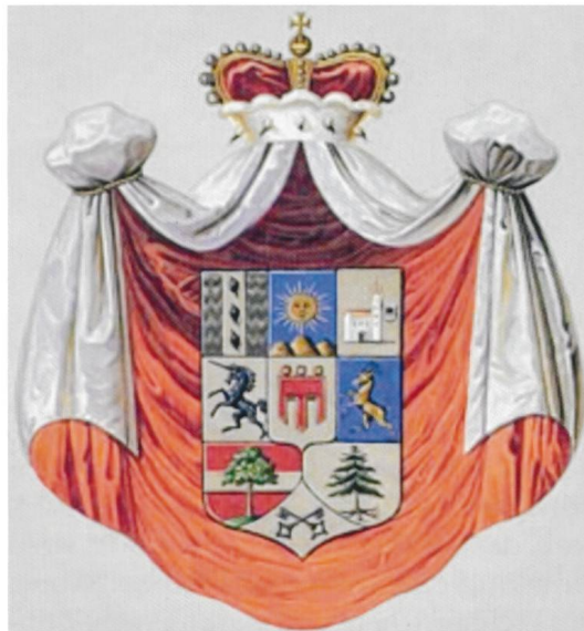
Im hier abgebildeten ehemaligen Landeswappen von Vorarlberg von 1863–1918 hat, ähnlich dem alten Wappen des Landkreises Waldshut, eine bewurzelte Tanne ihren Platz. 22

Diese Tanne findet sich auf mehreren Wappen von Orten, die im Bregenzer Wald zu dieser Selbstverwaltungskörperschaft gehörten. 22