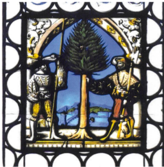
Hauensteiner Wappenscheibe im Rheinfelder Rathaus.

Die zweite Abbildung des Hauensteiner Wappens befindet sich innerhalb des Rathauses. Den Saal des Rathauses zieren nicht allein die Wappenscheiben von Adelsgeschlechtern unserer Landschaft, sondern auch die der Waldstädte und der Grafschaft Hauenstein. Anton Senti schildert: «Betreten wir den grossen Rathaussaal, so spielt dort die Wappenscheibe der Stadt Waldshut mit den Strahlen der Mittagssonne und schaut freundlich zur grünen Tanne von Hauenstein hinüber. Zwischendrin hielten aber einst die Abgeordneten der Fürsten, des Adels, der Städte und Länder des Oberrheins mit den Eidgenossen Tagsatzung.» 12