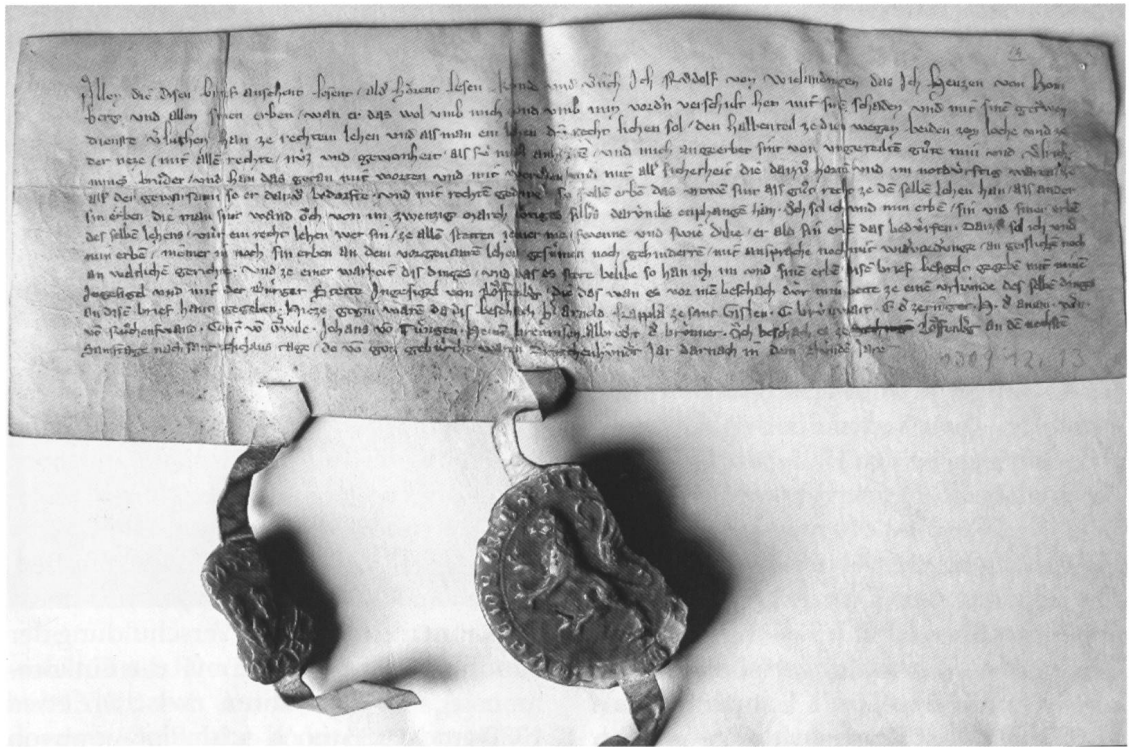
Abb. 2 Urkunde Rudolfs II. von Wieladingen mit seinem Siegel und dem Siegel der Stadt Lau- fenburg. Stadtarchiv Laufenburg, Urk. Nr. 4 (1309 Dez. 13).

malung des Wieladinger Wappens dürfte mit dieser politischen Ausrichtung beziehungsweise der Zugehörigkeit zur laufenburgischen Spitzenministerialität zusammenhängen. 34