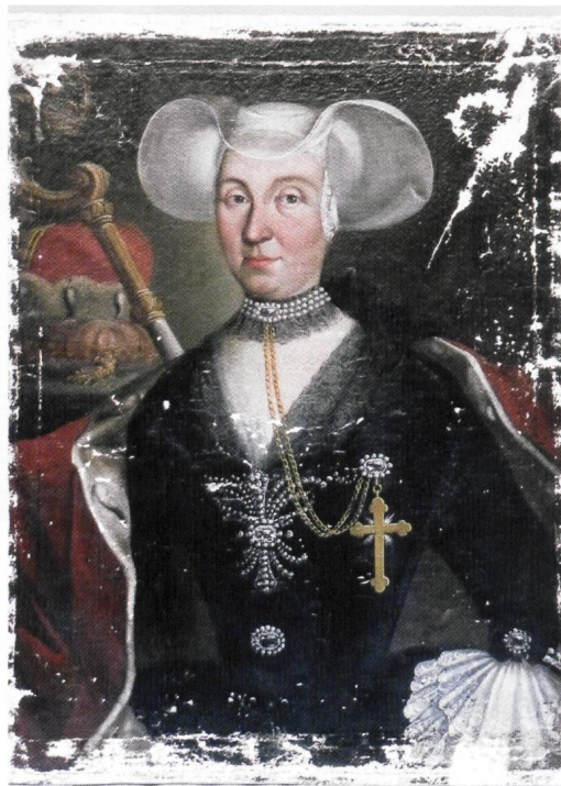
Abb. 7 Zustand nach Kittung der Ausbruchstellen und Wiederaufspannen auf den neuen Rahmen.

Zur Konsolidierung der Malschicht wurden lose Farbschollen mit Glutinleim (Hausenblasenleim) gefestigt. Das flüssige Bindemittel konnte unter aufstehende Schollen injiziert und nach dem Antrocknen des Leimes mit Druck und Wärme des Heizspachtels auf das Gewebe rückfixiert werden. Gereinigt wurde die Oberfläche zunächst durch eine Feuchtreinigung mit Wattetampon beziehungsweise Mikroporenschwämmchen und Wasser mit einem Zusatz von nichtionischem Tensid. Die Abnahme der grossflächigen, harten und