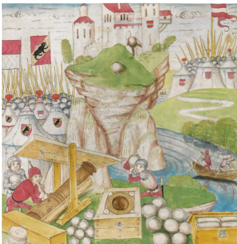
Abb. 8 Beschiessung der Inselburg Stein bei Rheinfeldens 1445. Auf dem gegenüberliegenden Ufer ist das Truppenlager von Herzog Albrecht VI. von Österreich erkennbar. (Aus der Amtlichen Berner Chronik von Diebold Schilling, 1478–1483)

Beute lockte nun auch in Rheinfeldens, wo die Basler mit ihren Verbündeten im Sommer 1445 den Stein belagerten und beschossen. Herzog Albrecht VI. konnte mit seinem Truppenaufmarsch am gegenüberliegenden Rheinufer die Kapitulation der Burgbesatzung nicht verhindern (Abb. 8).