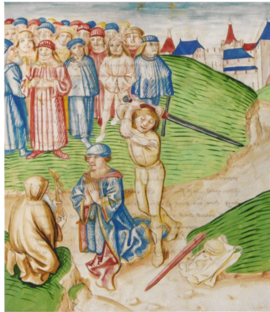
Abb. 11 Hinrichtung des burgundischen Landvogts Peter von Hagenbach in Breisach 1474. (Aus der Amtlichen Berner Chronik von Diebold Schilling, 1478–1483)

Ungelöste Rechts- und Grenzstreitigkeiten beidseits des Rheins führten am Ende des 15. Jahrhunderts zu Auseinandersetzungen zwischen den Eidgenossen und den «Schwabern». Ein solcher Streitpunkt war etwa das Thurgauer Landgericht, das sich im Besitz der Stadt Konstanz befand; bei einem anderen Konflikt ging es um Vog-