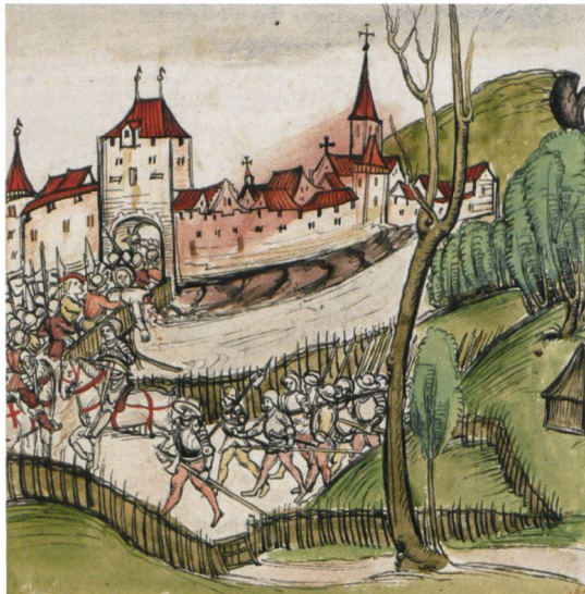
Abb. 6 Hans von Rechbergs Überfall auf Brugg 1444. (Aus der Bremgarter Schodoler Chronik, 1514–1532)

auf. Am 26. Juni begann ein etwa 20 000 Mann starkes eidgenössisches Heer mit der Belagerung der Limmatstadt, deren Verteidigung Rechberg organisierte und befehligte. Von Frankreich her nahte der bedrängten Stadt Hilfe. Der französische König Karl VII. liess ein vom Thronfolger angeführtes Söldnerheer, die Armagnaken, in Richtung Basel vorstossen.