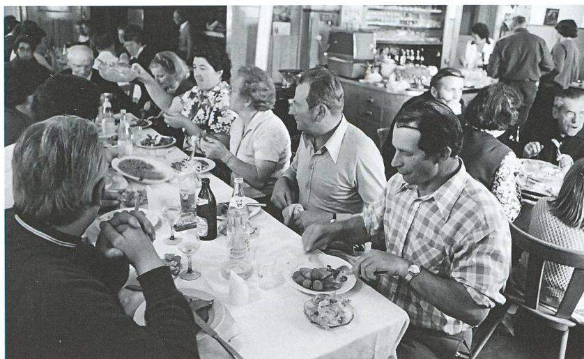
Abb. 5 Mittagessen im Gasthof zum Gugelturm in Giersbach 1975. Eine kleinere Gruppe wanderte weiter zum «Waldheim» in Kleinherrschwand, viele verpflegten sich aber im Freien aus dem Rucksack.

1991. Für zwei Jahre stand der «Kranz» nicht zur Verfügung, das Café Wasmer war die einzige Einkehrmöglichkeit. Zum Glück spielte das Wetter in den beiden Jahren mit, es war schön und warm, sodass viele der rund 260 Pilger im Freien lagern konnten. Zusätzlich nahm Willi Schilling (Junior) etwa 25 Leute in seinem «Hüsli» und der Garage auf.