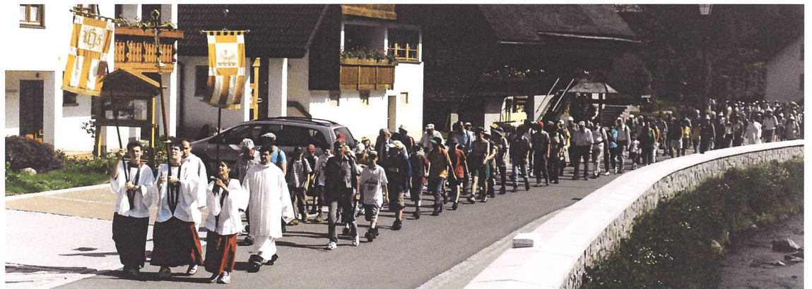
Abb. 9 Einzug in Todtmoos 2001.

Die Ankunft in Todtmoos mit Glockengeläute, das Abgeholtwerden am Ortseingang mit Kreuz und Fahne (Abb. 8 u. 9), das Einziehen in die Wallfahrtskirche unter Orgel- und Trompetenklang, all das lässt niemanden kalt. Endlich ist man zu Hause. Endlich bei der Gnadenmutter von