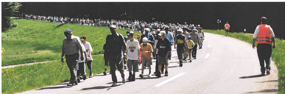
Abb.7 Verkehrsgruppe im Einsatz auf der L151 Richtung Hottingen anlässlich der Wallfahrt von 2001.

rüstung der meisten Männer so aus: Neben den Sonntagsschuhen trugen sie eine meist schwarze Kleidung (zumindest die älteren Herren) mit Krawatte, dazu selbstverständlich einen Hut. Neben dem Rosenkranz gehörte ein Regenschirm, der auch als Gehstock benutzt werden konnte, zur Ausrüstung (Abb. 6). Reservekleider wie Unterwäsche usw. trugen sie nicht mit. Bestenfalls Reservestrümpfe, die, wie der Schreibende das bei seinem Grossvater sah, mit einer Wäscheklammer an der Innentasche des Jacketts befestigt waren. Auch die Frauen und Mädchen waren der Zeit entsprechend gekleidet und ausgerüstet. Ausnahmslos alle trugen Röcke, wenige einen kleinen Rucksack. Hingegen schleppten viele eine relativ grosse Handtasche mit. All das ist eindrücklich im Film von der Wallfahrt 1962, gedreht von Oskar Keller, zu sehen.