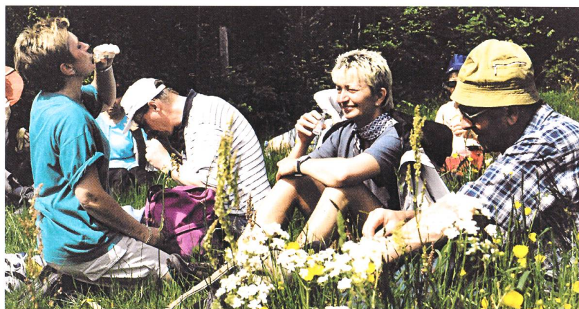
Abb. 4 Marschhalt nach dem steilen Katzenstieg 2001. Dieser Halt findet am Waldrand etwa 10 Minuten vor der Kapelle Hogschür statt und wird Schnapshalt genannt, weil etliche Männer die Gelegenheit nutzen, einen Schluck aus dem Flachmann zu nehmen. Viele Frauen haben Zuckerwürfel dabei und stärken sich mit einem «Canarli» (Zuckerwürfel, über den Schnaps geträufelt wird).

hat sich die Pause nach dem Freimarsch hinauf zur Wehrhalde dort oben angeboten. Alle anderen Marschhalte finden seit Menschengedenken an den gleichen Orten statt. Wo die Wallfahrer in alter Zeit Mittagspause hielten, ist aus den Aufzeichnungen nicht ersichtlich. Vermutlich rastete man schon damals auf der Höhe von Hogschür, wo der Pilgerzug um die Mittagszeit ankommt. Bis 1953 bestand die Möglichkeit, ein einfaches Mahl im dortigen Gasthaus Drei Könige einzunehmen. Im folgenden Jahr war die Wirtschaft geschlossen und der Mittagshalt wurde eine knappe Wegstunde weiter beim und im Gasthaus zum Gugelturm in Giersbach gemacht (Abb. 5). Wenige Jahre später, mit der Zunahme der Anzahl Pilger, kam der Gasthof Waldheim in Kleinherrischwand dazu.