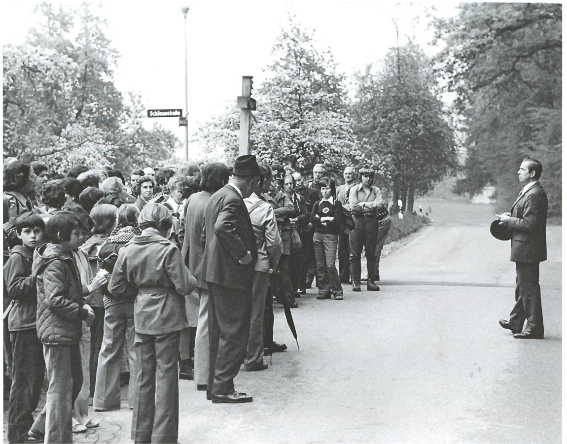
Abb.2 Begrüssung auf dem Sammelplatz Ziegel- hütte oberhalb Laufenburg DE 1975. Unter den 89 Teilneh- menden sind einige Kinder zu sehen. Heute kommen leider nur noch vereinzelt Kinder mit, meist aus Pilgerfamilien stammend.

beim Waldfriedhof. Auf dem Heimweg geschieht dasselbe in umgekehrter Reihenfolge.