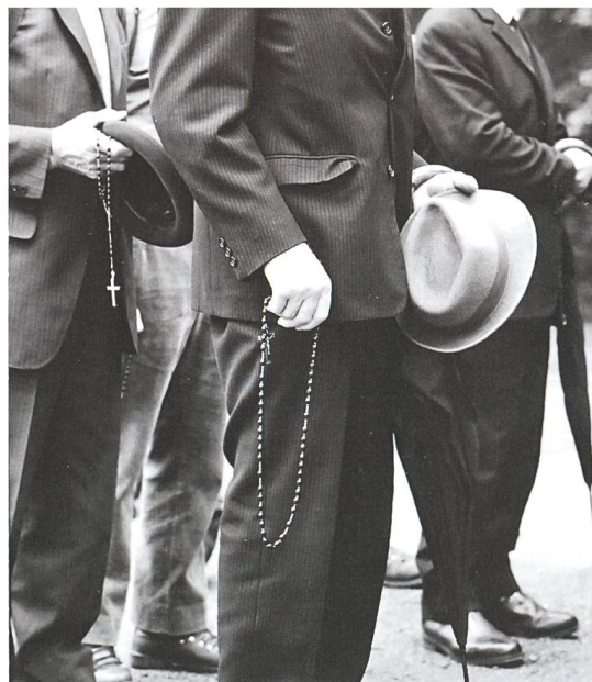
Abb. 6 Ausrüstung und Bekleidung der älteren Männer 1962. Blankgeputzte Schuhe, meist schwarze oder mindestens dunkle Kleidung mit Krawatte und Hut, Regenschirm und Rosenkranz – mehr brauchte es nicht.

Auf den bis nach dem Ersten Weltkrieg ungeteerten Strassen (Nebenstrassen bis in die 1960er-Jahre) und Wegen brauchte es robustes Schuhwerk und Kleidung. Meist wurde ein Rucksack oder eine Tasche mit dem Nötigsten mitgetragen. Mit der Asphaltierung der Hauptstrassen wurden die Sonntagsschuhe angezogen! Aufgrund der Möglichkeit, unterwegs in einem Gasthaus das Mittagessen einzunehmen, sah die Aus-