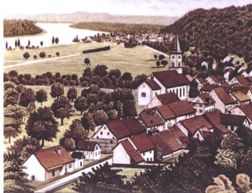
Abb. 6 Blick auf Oberschwörstadt um 1902.