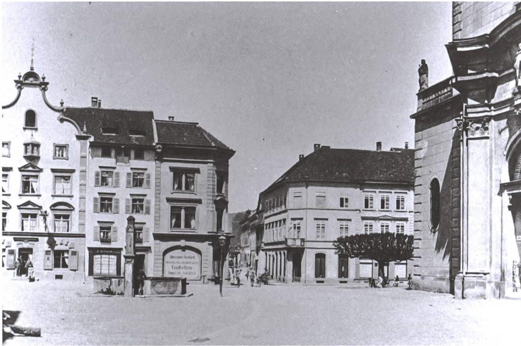
Abb. 7 Der Marktplatz in Säckingen um 1900.

Ich wünsche nur dass ich bald erlöst werde denn mir ist es so verleidet hier. Wenn ich mich nicht schenieren würde [würde] ich sofort nach Hause gehen aber ich will deiner Frau keine Freude machen u. sogleich wieder kommen. Wenn ich wenigstens nur ½ Jahr in Basel bin ist es genug. Morgens 8 Uhr bis abends 8½ bis 9 Uhr ständig geputzt. Blos zum Essen bin ich zum Sitzen gekommen. Ich bin so müde. Habe heute aufgekündigt. Bin aber schon das 5. Mädchen, das Sie dieses Jahr haben. 29