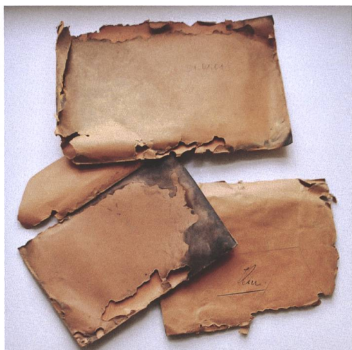
Abb. 1 In diesen Umschlägen wurden Maries Briefe aufbewahrt.