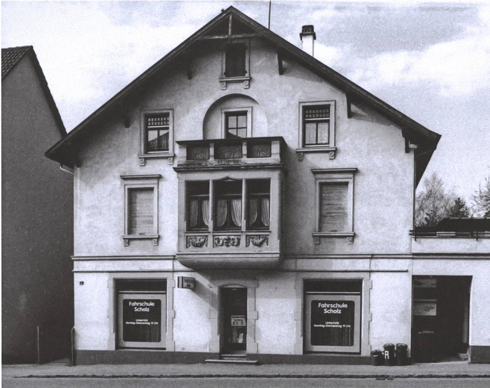
Abb. 8 Das Haus in der Bergseestrasse um 1990. Um diese Zeit wurden Marias Briefe gefunden.