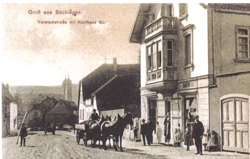
Abb. 2 Das Haus in der Bergseestrasse um 1910.