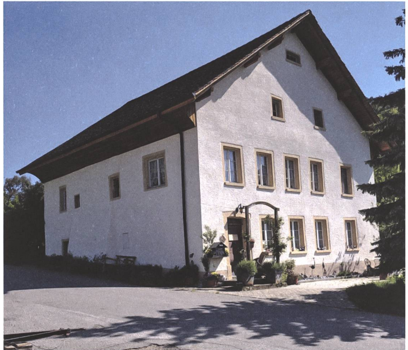
Abb. 2 Das historische Bauernhaus Nr. 91 im Weiler Benken. Wesent- liche Teile des Gebäudes stammen aus dem Jahr 1574.

Im Vertrag stehen genaue Angaben über den Hof. 5 Die Liegenschaft umfasste das Wohnhaus (Brandversicherungs-Nr. 91) [Abb. 2], den Schopf mit Kellergebäude (Nr. 92) und die gesondert stehenden Scheunen und Ställe nebst Einfahrt (Nr. 93). Die Fläche des Bauernhofes betrug 22 ha 12 a 73 m 2 , davon fast 6 ha Holz. Das war ein stattlicher Hof im Vergleich mit anderen Betrieben. 1888 waren im Bezirk Laufenburg 91,6% der landwirtschaftlichen Betriebe kleiner als 5 ha. 6