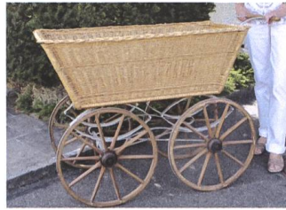
Abb. 6 Mit solchen Chaisen transportierten die Marktfahrerinnen im 19. und zu Beginn des 20. Jh. ihre Produkte auf den Aarauer Wochenmarkt.

fahrerinnen mussten in aller Frühe aufbrechen, damit sie um 7 Uhr ihre reichhaltigen Produktauslagen bestehend aus Früchten, Gemüse, Honig, Eiern und Butter auf dem Aarauer Wochenmarkt feilbieten konnten. Es war ein mehrstündiger Marsch auf staubigem Saumpfad. Im Herbst wurden Trauben angeboten und oft auch gewobene Bänder. Auch an den Viehmarkt wurde marschiert, oft wurde man sich schon vor Aarau handels-einig und mit einem kräftigen Handschlag wechselte das Tier den Besitzer. 12 In Erinnerung an die einstige Zugehörigkeit zu Österreich umschrieben ältere Einwohner die Reise in die Kantonshauptstadt noch zu Beginn des 20. Jahrhunderts mit den Worten: Ich go i d Schwiz ie. 13