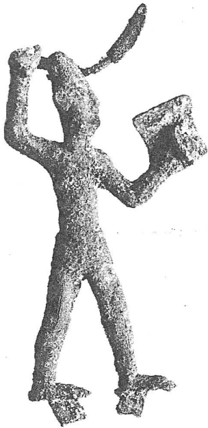
Abbildung 1. Gott aus Megiddo. 6

grösser als 15 cm, nur wenige Fragmente lassen auf grössere (bis menschengrosse) Statuen schliessen. Die Abb. 1 soll wenigstens einen Eindruck einem solchen Kultbild vermitteln: