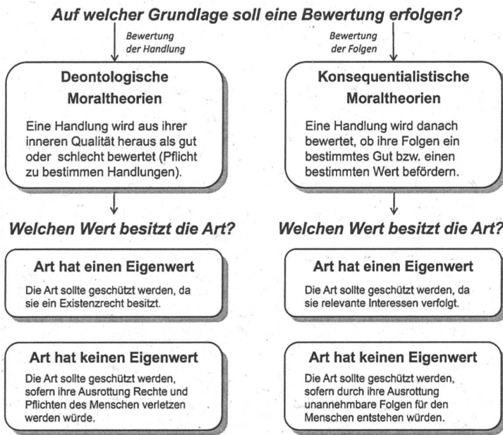
Abbildung 3. Mögliche normative Begründungen für den Artenschutz in Abhängigkeit von moralphilosophischer Theorie und der Zuschreibung eines Eigenwertes

Wissenschaftliche Erkenntnisse auf der einen Seite und politische Entscheidungen auf der anderen Seite würden nicht ausreichend getrennt: Die lineare Beziehung zwischen Wissenschaft und Politik fehle, in der «gute» Wissenschaft ausschliesslich objektive Erkenntnisse liefere und die Entscheidung allein der Politik überlassen sei (Pielke 2004). Tatsächlich sprechen sich einige Umweltwissenschaftler dafür aus, aktiv auf umweltpolitische Entwicklungen Einfluss zu nehmen und sich für Anliegen des Naturschutzes einzusetzen: Beispielsweise betonen Meffe und Viederman (1995), dass sich Umweltwissenschaftler dazu bekennen sollten, dass Biodiversität, intakte Ökosysteme und evolutionärer Wandel etwas «Gutes» seien; sie sollten sich bewusst nicht vor Werturteilen verschliessen (Meffe & Viederman 1995). Auch wenn eine Mehrheit der Forscher dieser Aussage wohl widersprechen würde, macht sie deutlich, wie sehr in der Disziplin um das Verhältnis von wissenschaftlichen Erkenntnissen zu präskriptiv-normativen Aussagen gerungen wird.