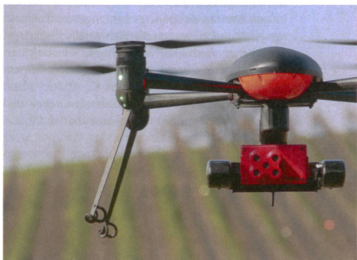
Drohne mit Hyperspektralkamera zur Früherkennung von pilzlichen Erkrankungen von Reben.

Dieses weite Feld an Themen wird zusätzlich durch das gesellschaftliche, wirtschaftliche, technologische und natürliche Umfeld beeinflusst. Dazu einige Beispiele, die heute zu Kontroversen führen: Die Landwirtschaft würde sich ohne den politischen Willen zur Förderung der dezentralen Besiedelung der Schweiz (Artikel 104 der Verfassung) aus ökonomischen Gründen aus dem alpinen und voralpinen Gebiet zurückziehen. Andererseits eröffnen Trends in der Ernährung wie Veganismus oder neue Formen der Zusammenarbeit zwischen Landwirtschaft und Verbraucher (Solidarische Landwirtschaft) neue Chancen. Sodann wird die Gentechnologie in Zukunft verstärkt zur Herausforderung, insbesondere weil die Weiterentwicklung der Verfahren eine einfache Unterscheidung zwischen gelenkter natürlicher Vererbung und Gentechnik erschweren wird. Des Weiteren fasst die Digitalisierung auch in der Landwirtschaft schnell Fuss: So werden z.B. Äpfel, bevor sie in den Verkauf gelangen, oder Getreidekörner vor dem Mahlen von Computern gescannt und sortiert. Diese Verfahren laufen nicht mehr auf Versuchsebene, sondern sind heute Realität in der Verarbeitung. Schliesslich fordern natürliche Umweltfaktoren die Landwirtschaft weit mehr als noch vor zwanzig Jahren – zum Beispiel gelangen immer öfter neuartige Pflanzenschädlinge in die Schweiz oder verbreiten sich dank der Klimaerwärmung in neue Gebiete.