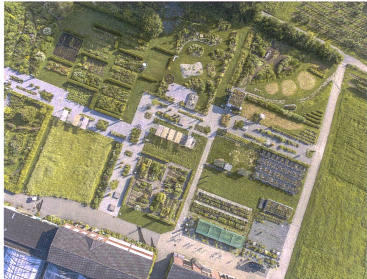
Luftaufnahme Gärten im Grüental, Institut für Umwelt und Natürliche Ressourcen

Für den Bildungsbereich heisst das: Junge Menschen müssen nicht nur befähigt werden, Lebensmittel anzubauen und zu produzieren, sondern auch, unternehmerisch aktiv zu werden. Die Bedeutung neuer, innovativer Businessideen, von Networking und Vermarktung nimmt zu. Unternehmer werden in Zukunft vermehrt Verantwortung für den gesamten Produkteprozess übernehmen und diesbezüglich Transparenz und Vertrauen bei ihren Kunden schaffen müssen. Eine entsprechende Sensibilisierung gehört damit in die Ausbildung potenzieller Agrofood-Unternehmerinnen und -Unternehmer.