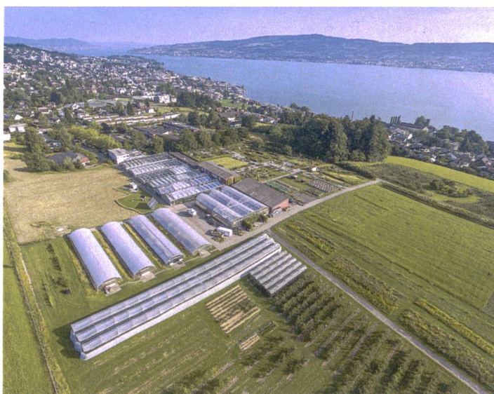
Luftaufnahme Campus Grüental mit Gärten, Gewächshäusern und Anbauflächen.

Die angewandte Forschung und Entwicklung des IUNR im Bereich der Agrarwissenschaften entwickelte sich erst in den letzten 15 bis 20 Jahren auf Grund des vierfachen Leistungsauftrags gemäss Artikel 3 des Fachhochschulgesetzes (Lehre, Weiterbildung, Forschungs- und Entwicklungsarbeiten und Dienstleistungen für Dritte). Dabei galt es, sich in einer von Universitäten und bundeseigenen Forschungsanstalten schon besetzten Forschungslandschaft zu positionieren oder – wie im Falle des IUNR – neue Felder zu erschliessen. Hinzu kommt, dass die Fachhochschulen nicht über eine Grundfinanzierung für die Forschung verfügen, d.h. Forschung ist nur dort möglich, wo Drittmittel akquiriert werden können. Zu den wichtigsten Geldgebern des IUNR im Bereich der Agrarforschung gehören staatliche Forschungsagenturen (NF, KTI/Innosuisse und Bundesämter), private Unternehmungen im Agrarbereich und Stif-