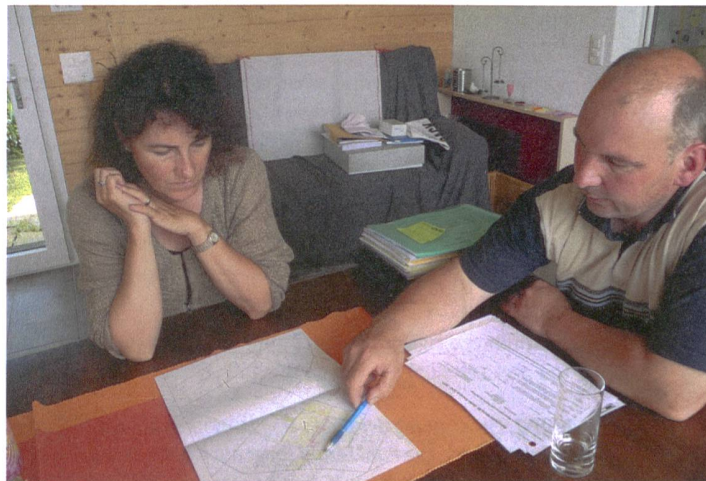
Abb. 6. Eine gesamtbetriebliche Beratung führt oft zu verbesserten Biodiversitätsleistungen sowie zu einer Veränderung der Einstellung des Landwirtes gegenüber ökologischen Fragestellungen.

Soziologische Begleituntersuchungen zeigten, dass die Beratung nicht nur zur ökologischen Aufwertung des Kulturlandes führte, sondern dass die Landwirte auch ihre Einstellung änderten. Die beratenen Landwirte erkannten unter anderem stärker, dass die Pro-