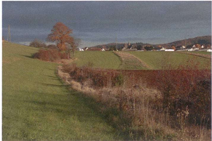
Abb. 3. Diese Landschaft ist mit den Biodiversitätsförderflächen Hecken und Säumen auf Ackerland sehr gut vernetzt.