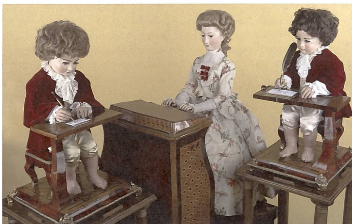
Abb. 3. Figurenautomaten der Jaquet-Droz (1774). Die drei voll funktionsfähigen Androiden (Zeichner, Musikerin, Schriftsteller, von links nach rechts) gelten als die weltweit schönsten und ausgereiftesten Figurenautomaten.

Die Wiener Kunstammer beherbergt zahlreiche grossartige Automaten, z.B. einen Schiffsautomaten (vgl. Abb. 4),