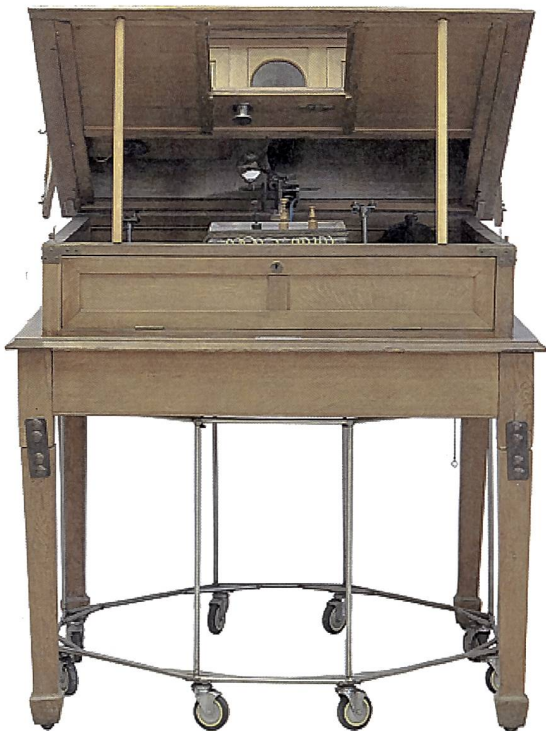
Abb. 6. Schachautomat von Leonardo Torres Quevedo (1920). Norbert Wiener spielte 1951 auf der Pariser Kybernetikkonferenz gegen diese Endspielmaschine.

Die erste funktionsfähige Schachmaschine (1920) ist das Werk von Leonardo Torres Quevedo (vgl. Abb. 6). Der Automat, der 1958 auf der Weltausstellung in