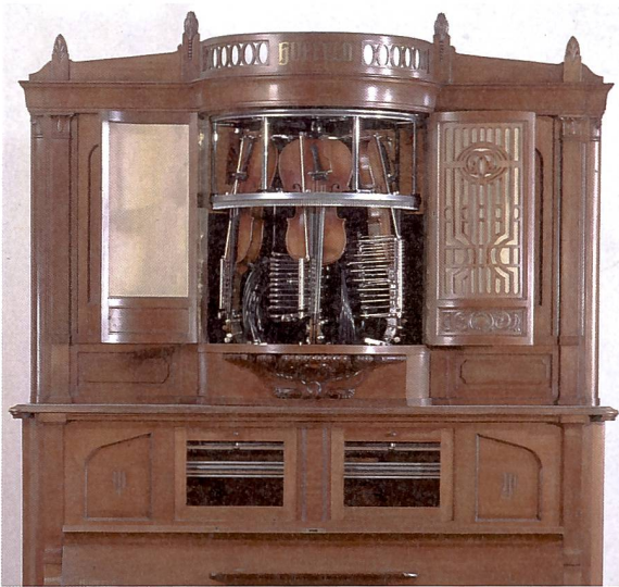
Abb. 5. Phonoliszt-Violine (1908). Der nach wie vor betriebsfähige Violinautomat der Firma Ludwig Hupfeld AG, Leipzig, besteht aus einem Klavier und drei sich drehenden Geigen. Die Steuerung erfolgt über eine Papiernote Rolle.

Für Unterhaltung sorgten auch vielfältige Musikautomaten, etwa großartige Violinmaschinen, die als Weltwunder galten (vgl. Abb. 5).