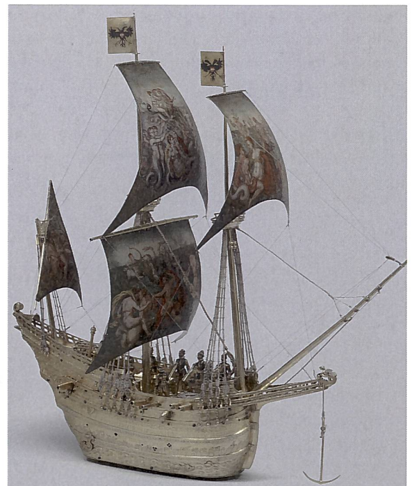
Abb. 4. Schiffsautomat (1785). Der Tischautomat von Hans Schlottheim rollt über den Tisch und spielt Musik. Die Kanonen lassen sich mit Schwarzpulver laden.