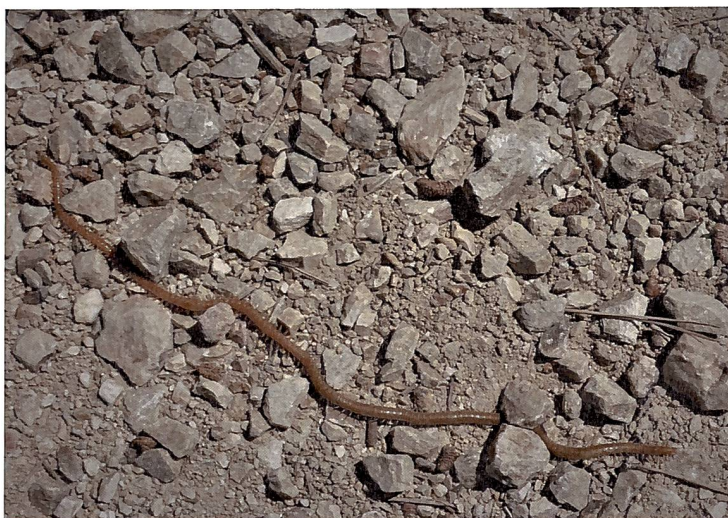
Abb. 1. Wie stellen wir es an, uns in einen Tausendfüßler einzufühlen?