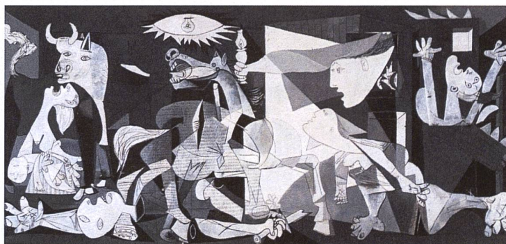
Abbildung 3. Pablo Picasso, 1937: Guernica 19

Das Eingreifen Deutschlands und Italiens auf der Seite der Putschisten und der Sowjetunion auf der Seite der auseinanderbrechenden Republik sowie die Passivität