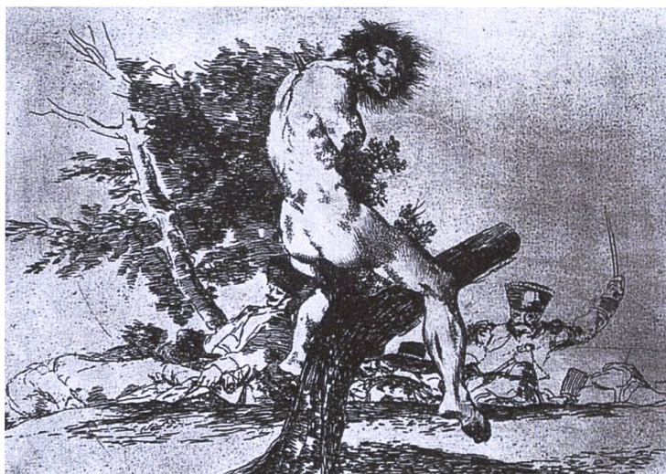
Abbildung 2. Francisco de Goya y Lucientes, (1810–1814): aus den «Desastres de la Guerra»: Esto es peor . 18

Als besonders geeignetes Beispiel für die fachinterne Interdisziplinarität kann die Bedeutung des spanischen Bürgerkriegs (1936–1939) angeführt werden. Da im normalen Geschichtsunterricht aus zeitlichen Gründen vor allem Nationalsozialismus und Faschis-