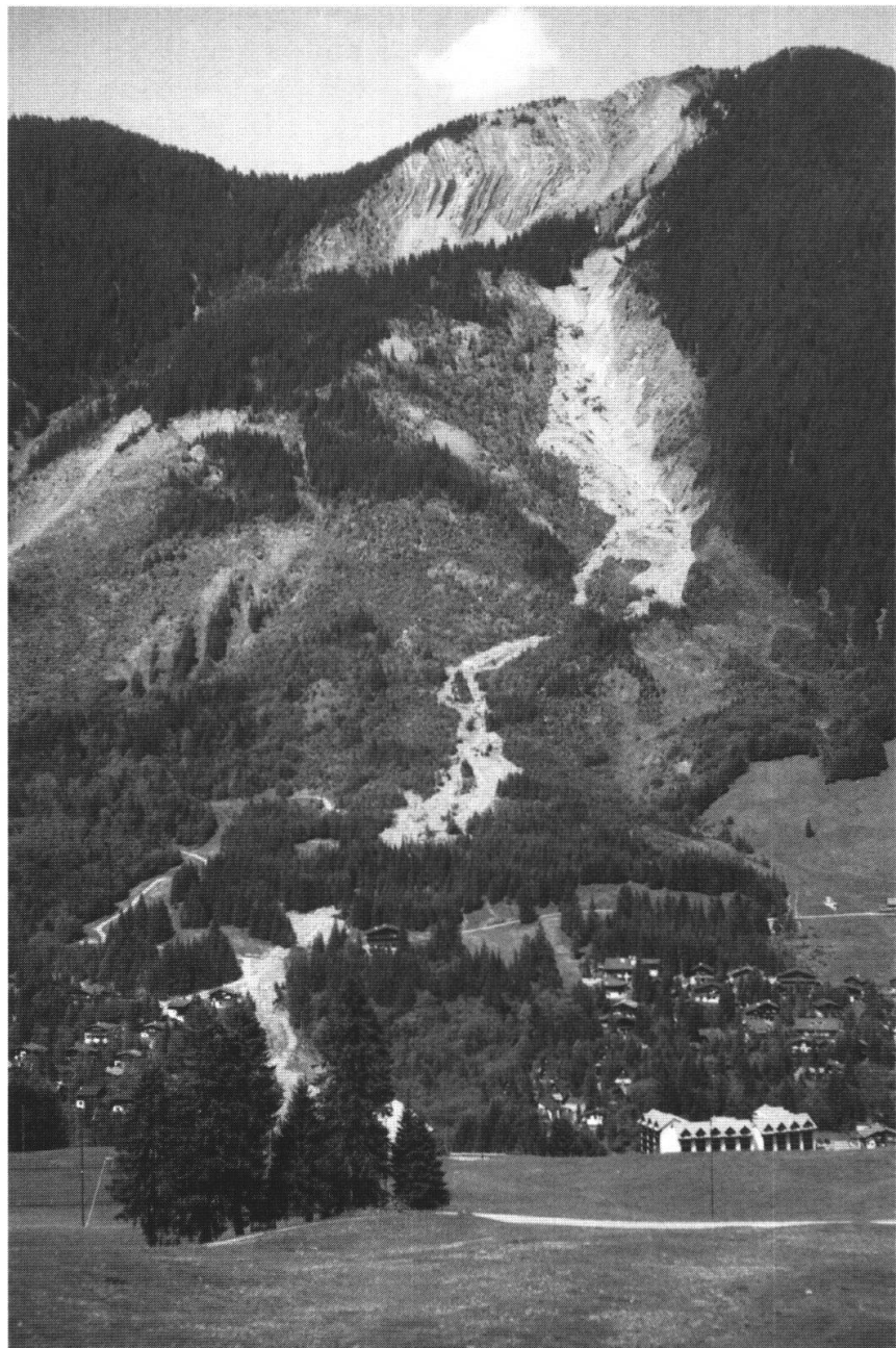
Fig. 2: Blick Richtung Nünalpstock (rechter Bildrand oben) und die "Lau" mit den Spuren der Murgänge vom Mai 1999.

Die klimatischen Verhältnisse vor und während den Ereignissen von 1910 und 1999 gleichen sich sehr stark. In beiden Fällen war ein schneereicher Winter vorausgegangen. Die Schneeschmelze wurde im Mai von heftigen Niederschlägen begleitet, welche zu sehr hohen Seepegeln und vielen Überschwemmungen im Unterland führten. Die Niederschläge lösten in beiden Fällen am Nünalpstock grosse Rutschungen aus, aus welchen sich Murgänge bis zur Waldemme hinunter ergossen. Die Ereignisse von 1910 waren weit grösser, weil die vorausgegangenen Rutschungs- und Sackungsbewegungen sehr stark waren (mehrere Dekameter, siehe oben). Dagegen waren die Bewegungen vor dem Ereignis von 1999 eher gering mit einigen Zentimetern pro Jahr (siehe Fig. 3). Die Ereignisse von 1922 und 1986 begannen ebenfalls im Frühjahr während Tauphasen.