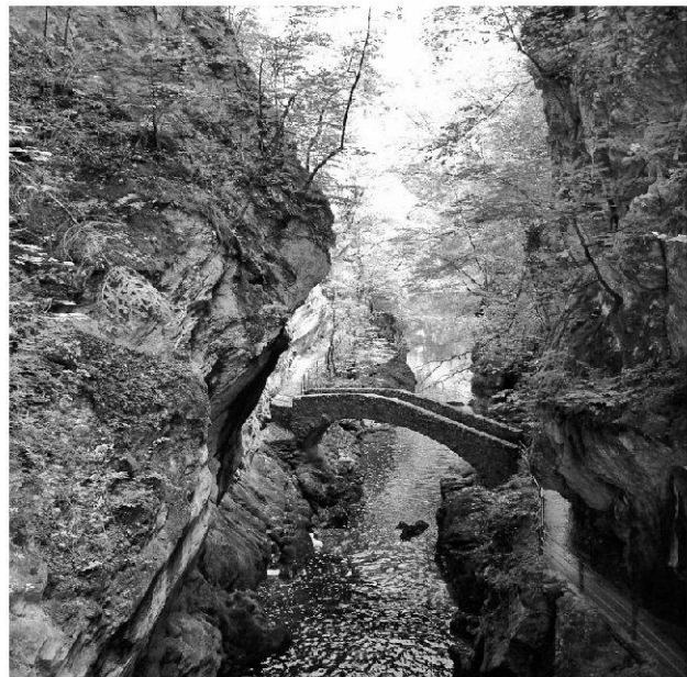
Fig. 3: Val de Travers, Schlucht der Areuse | Val de Travers, gorge of the Areuse river.

The final programme of the Annual Meeting and documents for the registration will be published on the Web Site ( www.vsp-asp.ch ).