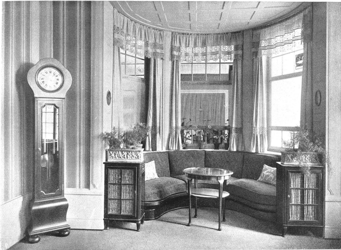
Fenster Ecke aus demselben Zimmer.

Maße dem Künstler. Es steckt in seinen Entwürfen und Skizzen voll lebendiger Anregungen. Der Schaffende, der jedes Werk nur nach dem künstlerischen, nicht nach dem historischen Werte bemißt, wird bei Frank Buchser stets auf seine Rechnung kommen.