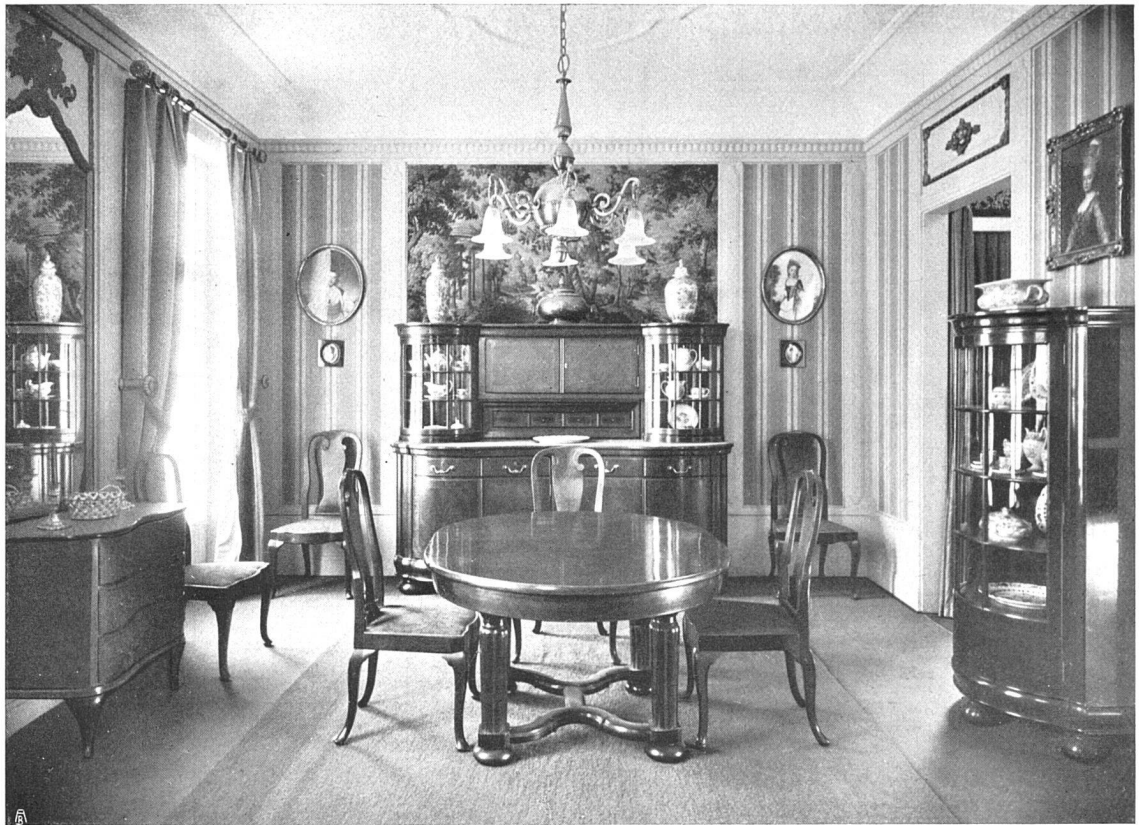
Raumkunst an der Schweizerischen Landesausstellung. Fränkel & Völlmy, Basel. Speisezimmer in barocken Linien in maserigem Nußbaumholz poliert. Holz in altgoldton gestimmt.

Bildern am klarsten zum Ausdruck, die Buchsers in seinen Skizzen. Die fertigen Bilder Buchsers haben fast alle etwas Zeitliches an sich, im Wollen verblüffend neu und revolutionär, drückt ihnen die Durcharbeitung den Stempel ihrer Zeit auf. In den Skizzen bleibt nur der leidenschaftliche Ringer mit neuen Problemen, die er all den spätern Schulen vorweg nimmt und mit genialer Unbefangenheit be- meistert. Buchser läßt sich von den widersprechendsten Vorbildern zur eigenen Produktion anregen, und fast jede dieser Nacheiferungen läßt an einen andern spätern Meister denken, der diese Art des Schauens und Schaffens bis zum Typischen durcharbeitete; während sie bei Buchser nur wie zufällig anklingt und deshalb nicht die nachhaltige Wirkung ausüben konnte. Deshalb auch steht das Kunstschaffen Buchsers so neben aller Entwicklung in