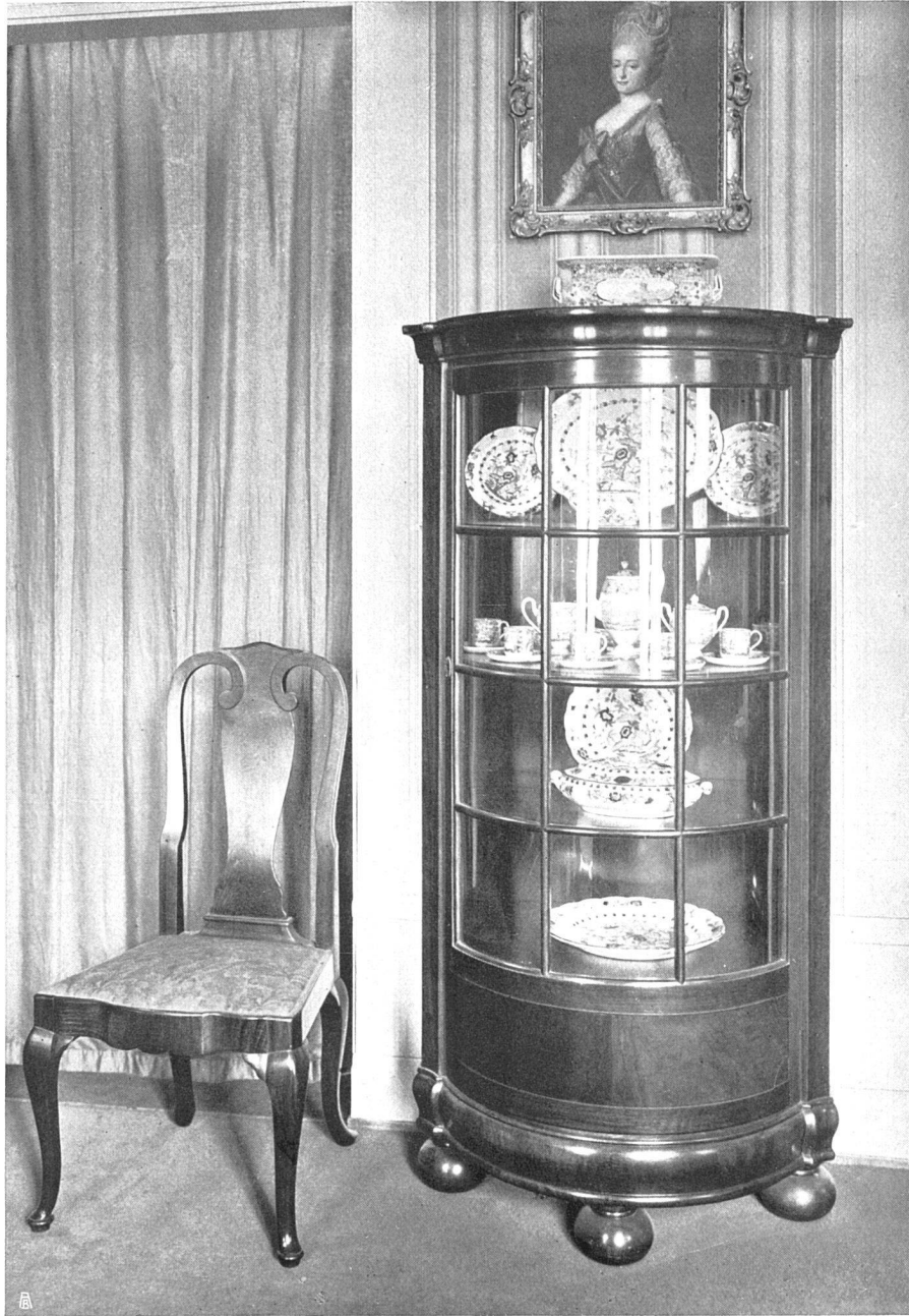
Zierschrank und Stuhl aus demselben Zimmer.

ähnliche Probleme folgen ihnen auf ihren verschiedenen, beinahe entgegengesetzten Wegen. Man sehe sich darauf hin die vielen gleichartigen Motive an, in denen Buchser das in Rot, Weiß und Blau gekleidete Mädchen farbig gestaltet.