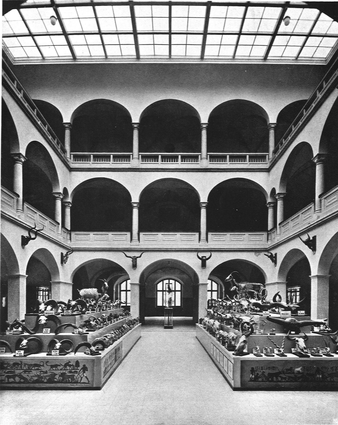
Gebäude für Land- und Forstwirtschaft