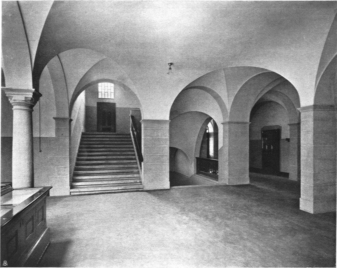
Gebäude für Landwirtschaft und Forstwirtschaft