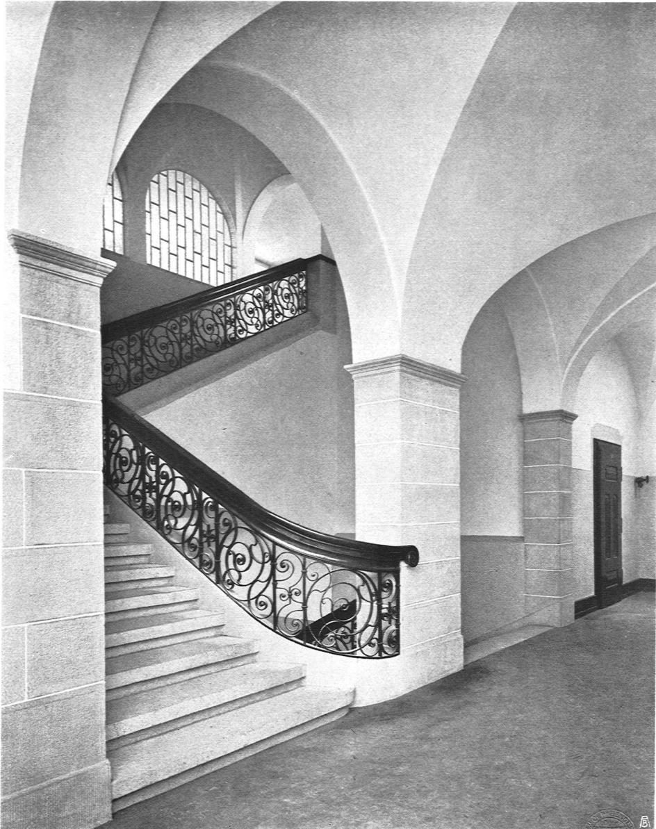
Gebäude für Land- und Forstwirtschaft