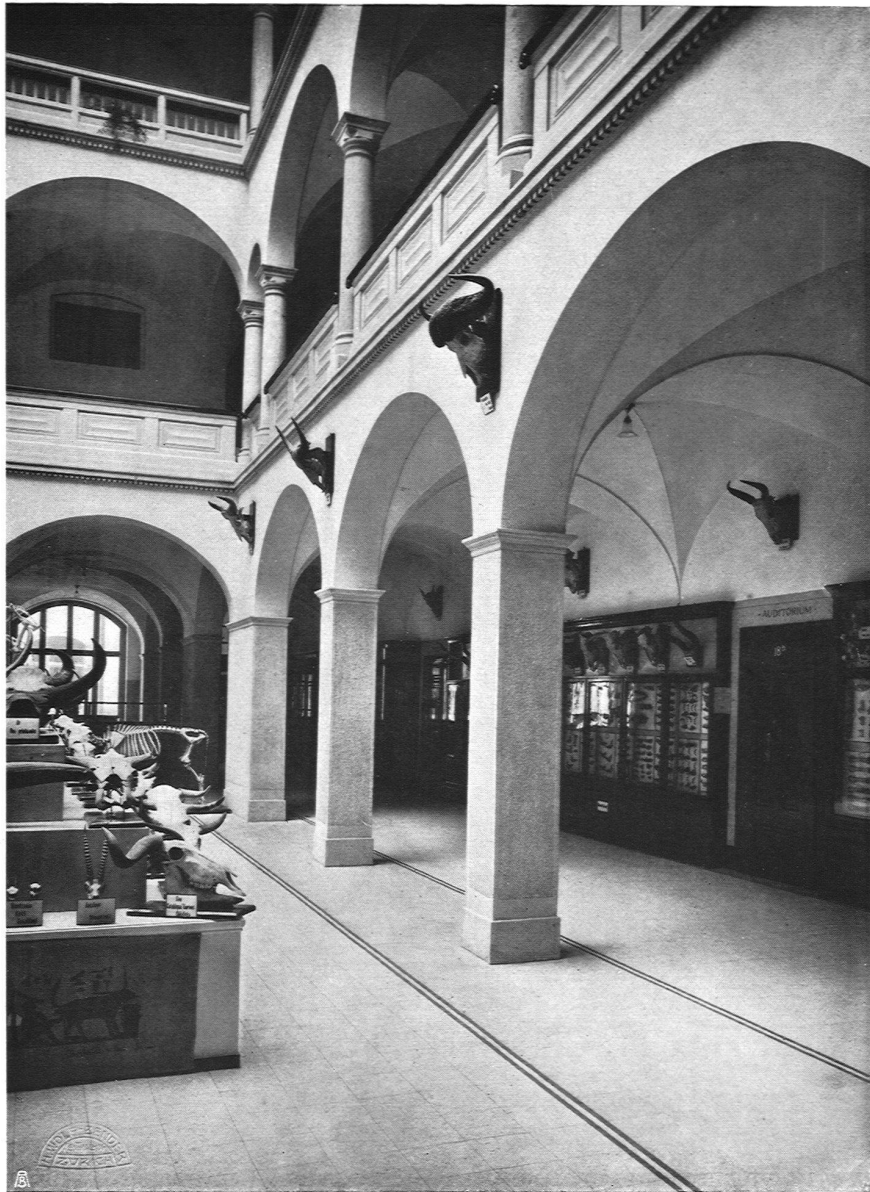
Gebäude für Land- und Forstwirtschaft