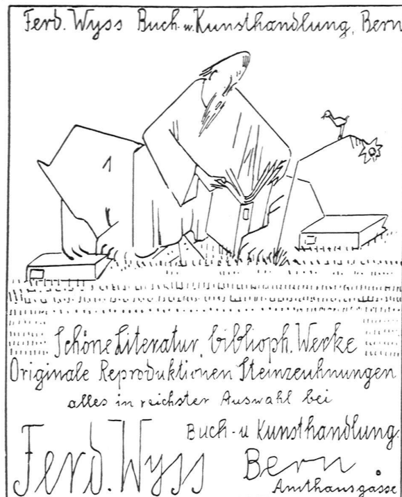
ZEICHNUNG AUS DEM WERKWETTBEWERB VON ERNST MORGENTHALER, BURGDORF