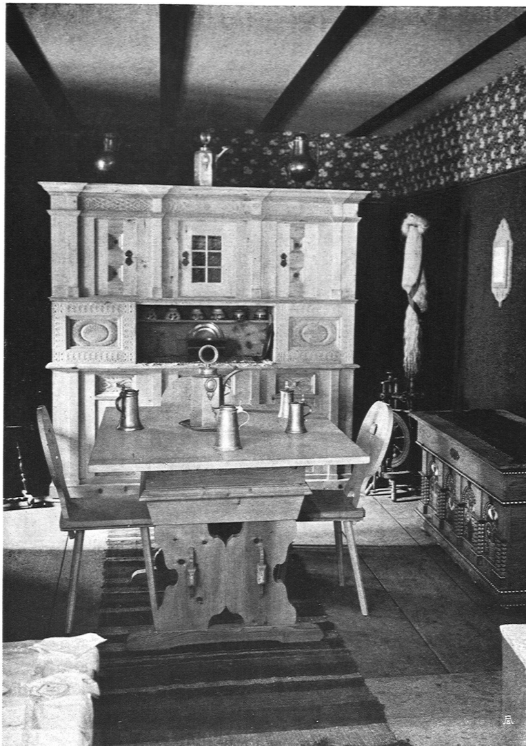
Bauernmöbel Entworfen von Jösler und Zai, Archit., und G. Brunold, Arch. Ausgeführt von B. Jäger u. Chr. Brunold, Arosa

forderung an die eigene Opferwilligkeit dafür um so sicherer war. Doch der Aufruf fand eifriges Gehör, die Arbeit wurde pünktlich geleistet. Reger Besuch, guter finanzieller Erfolg gaben den sichtbaren und greifbaren Lohn!