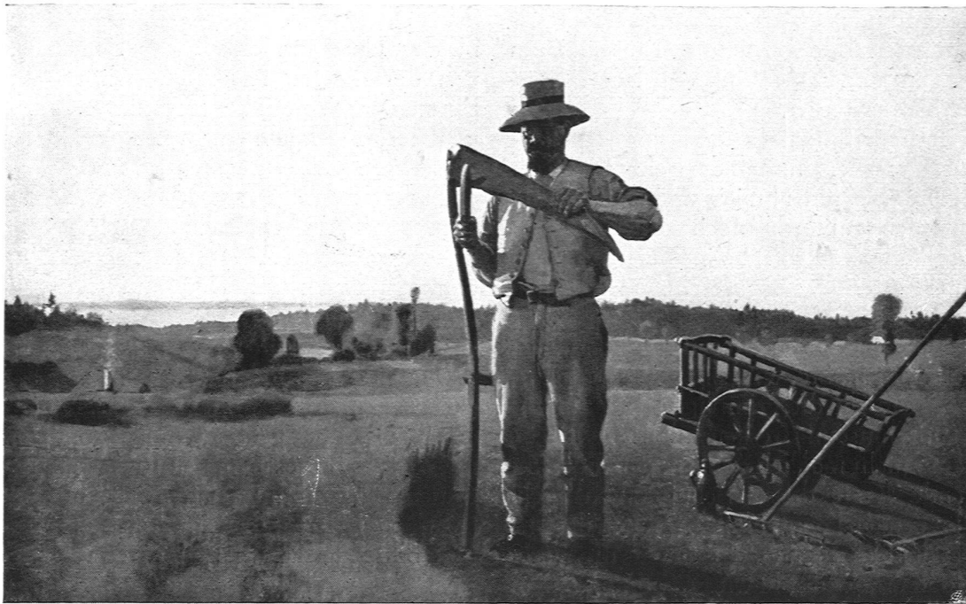
Ferdinand Hodler. Der Mäher

Langenthal, ca. 1879. Privatbesitz, Zürich