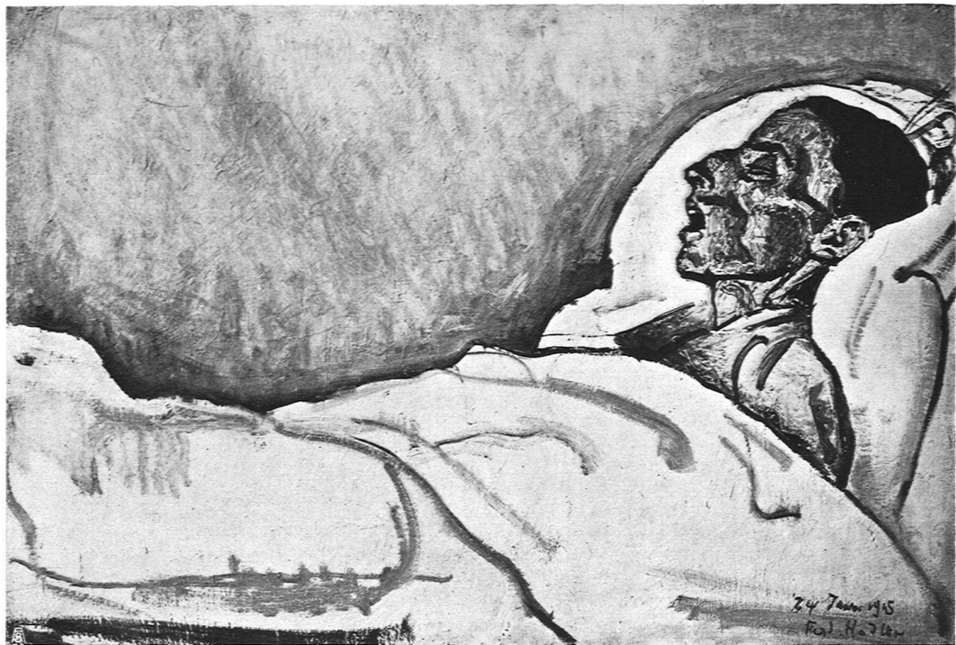
Ferdinand Hodler. Eine Sterbende