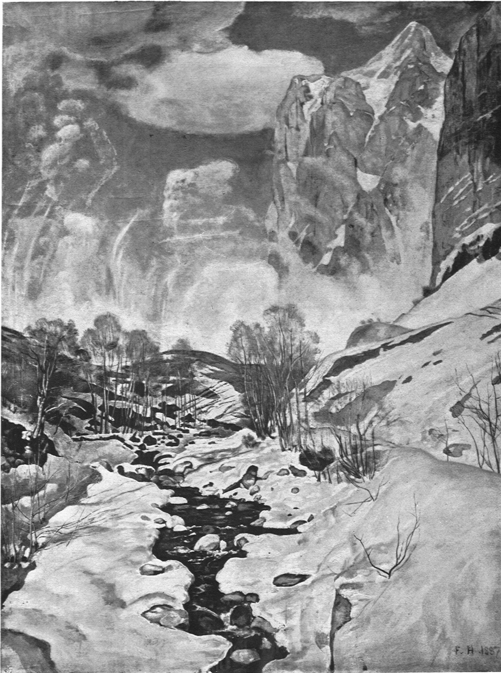
Ferdinand Hodler. Die Lawine