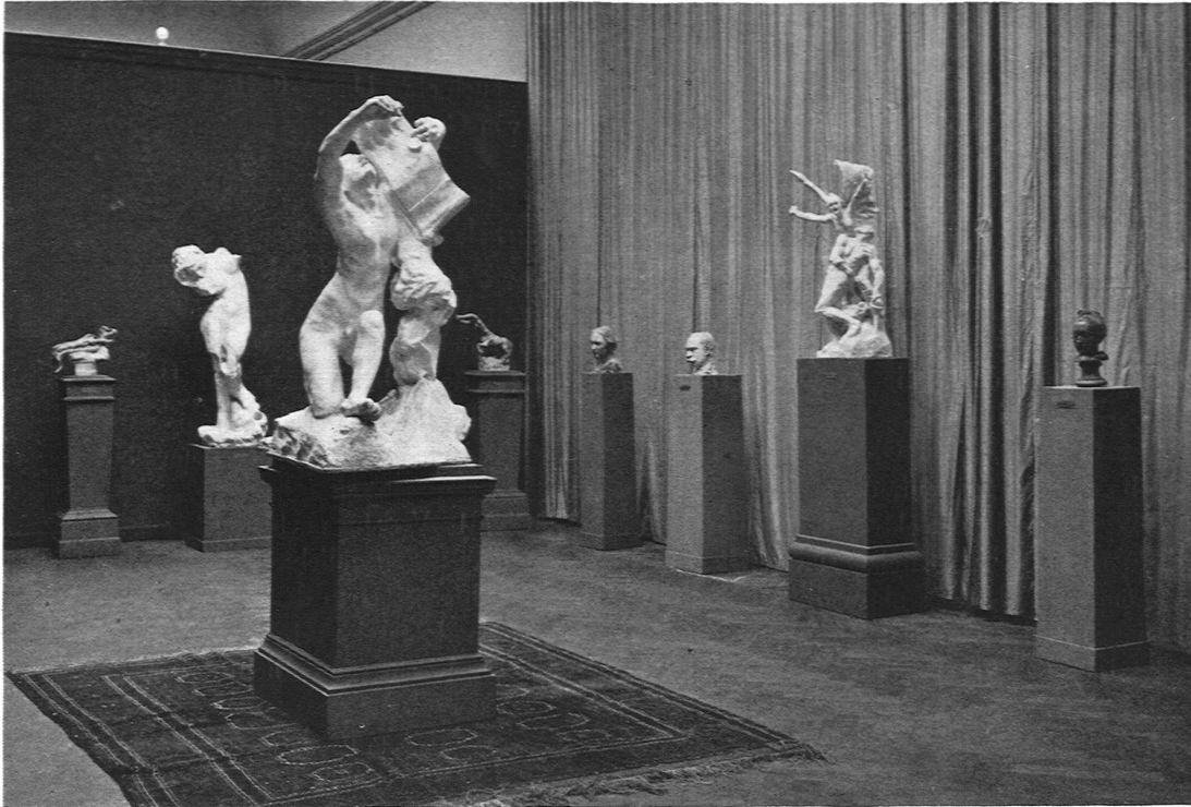
Aus der Rodin-Ausstellung in Basel