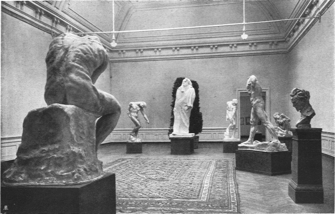
Rodin-Ausstellung in Basel