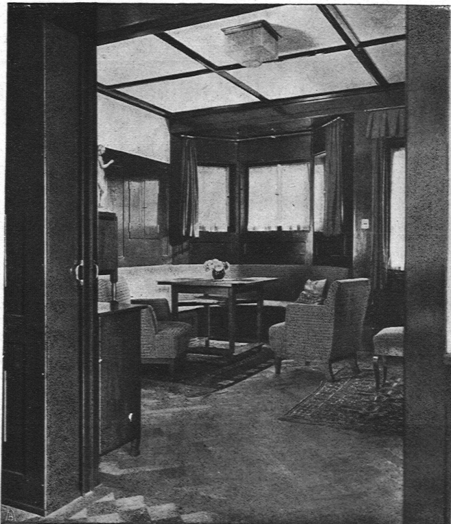
Wohnraum mit Eternit-Decken- füllungen

A. & R. Wiedemar, Bern Spezialfabrik für Kassen- und Tresor-Bau Bestbewährte Systeme, moderne Einrichtungen Gegr. 1862 / Goldene Medaille S. L. A. B. 1914 / Gegr. 1862