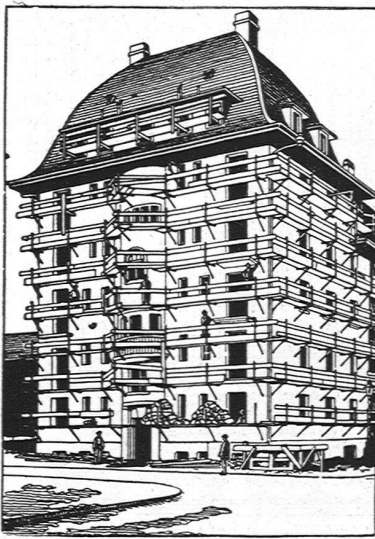
Ansicht eines eingerüsteten Hauses