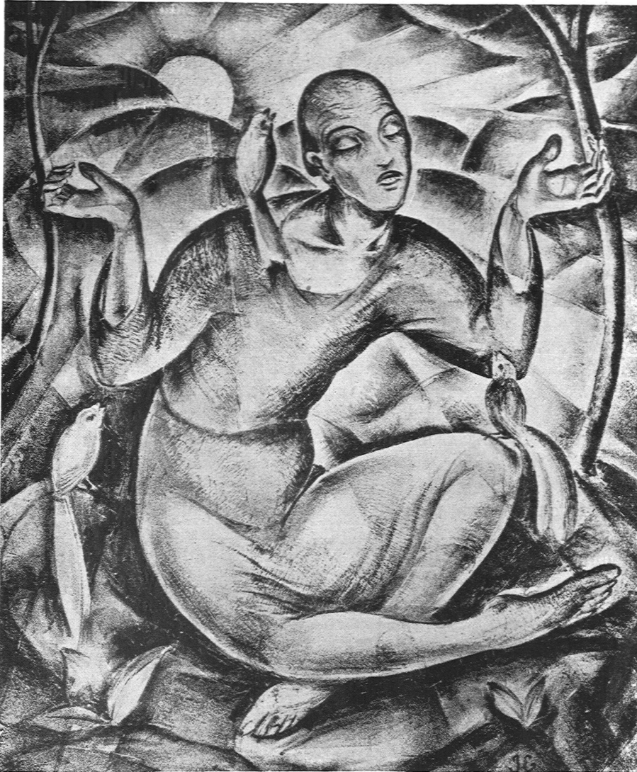
Ignaz Epper: Der heilige Antonius