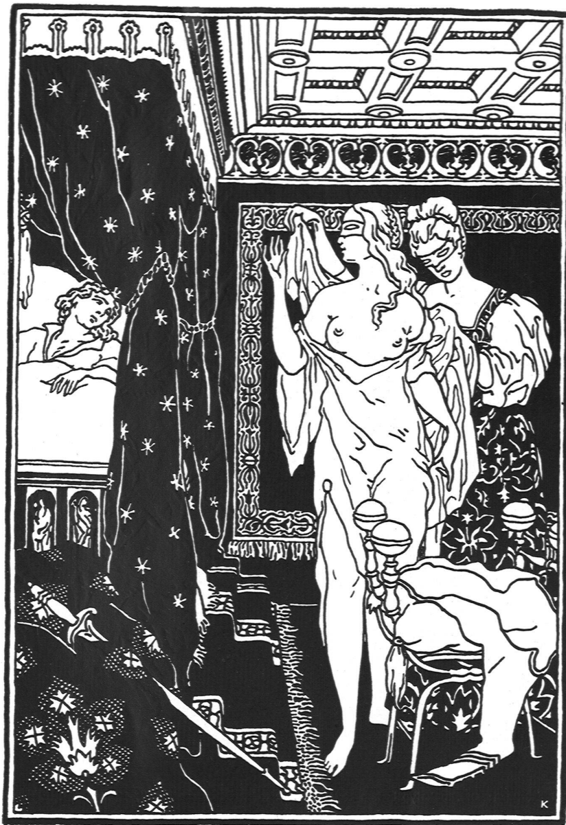
Paul Kammüller, Basel Illustration zu W. Keller, Die schönsten altitalienischen Novellen. Orell Füßli, Zürich

Über seine Absichten läßt der Verfasser keinen Zweifel aufkommen, und das wollen wir ihm gutschreiben. Daß die Erscheinungen der Kriegspsychose seiner Überzeugung recht zu geben schienen, erfüllt ihn mit Genugtuung. Das deutsche Volk schien umzukehren von den Wegen, die es in die Irre geführt, d. h. man verleumdete die Vertreter einer modernen Kunst