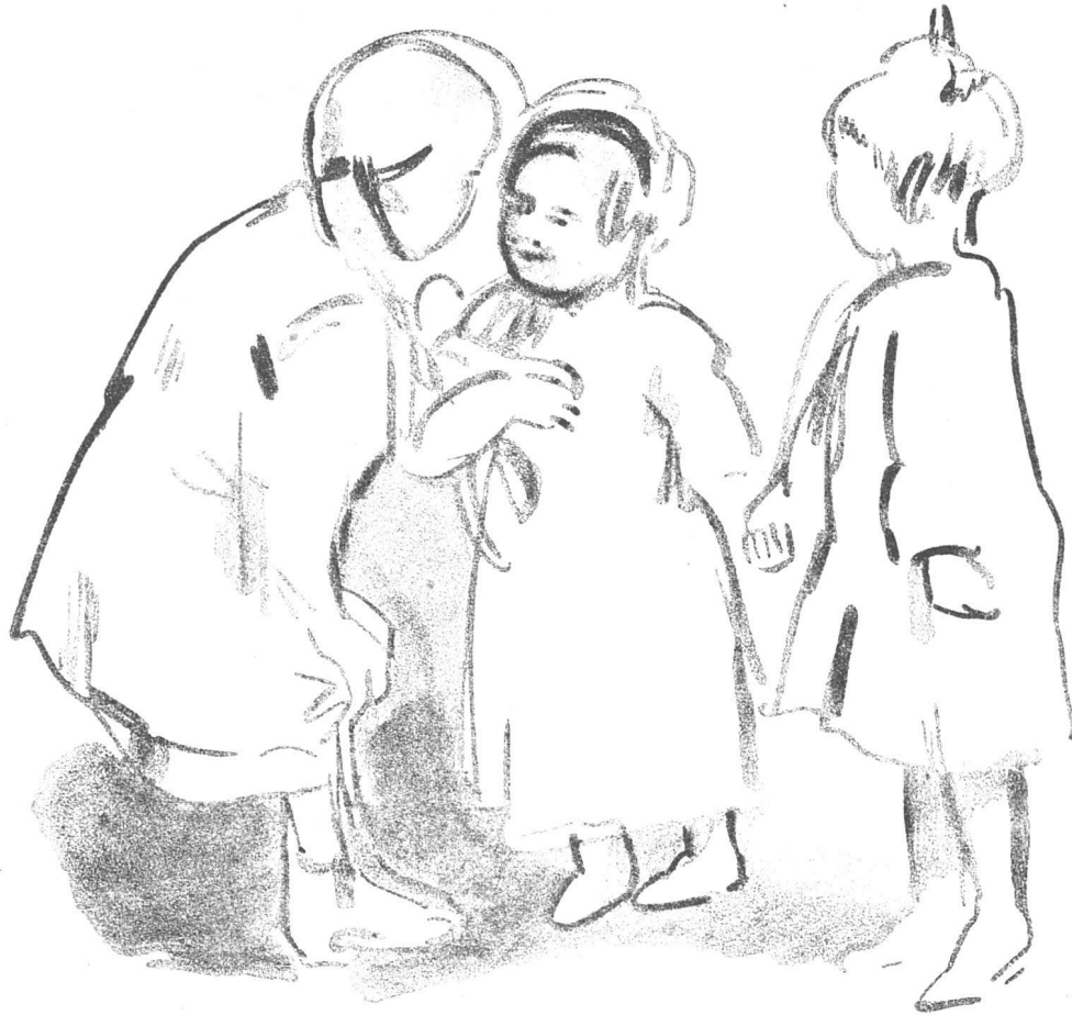
H. BAY, ZÜRICH