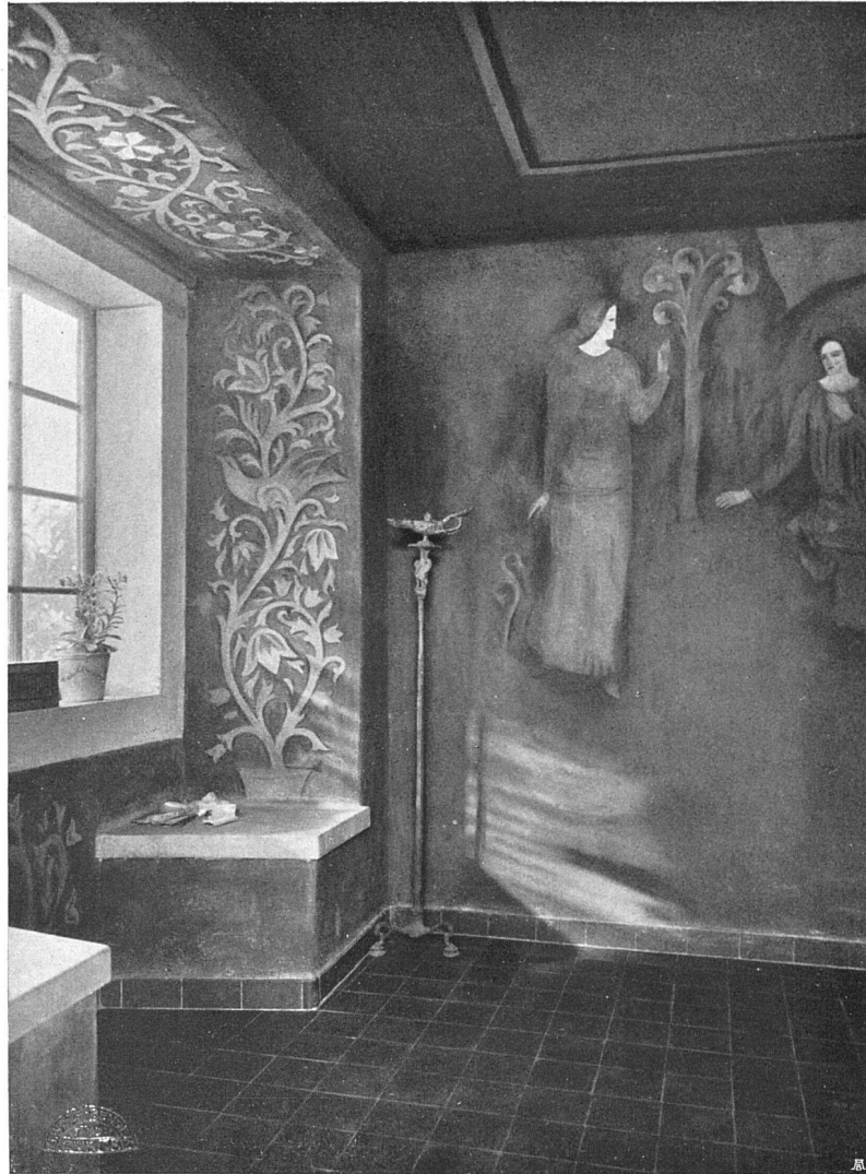
Gartenhaus. Architekten Vogelsanger & Maurer, Rüschtikon Wandmalereien von O. Vollenweider, Maler, Zürich