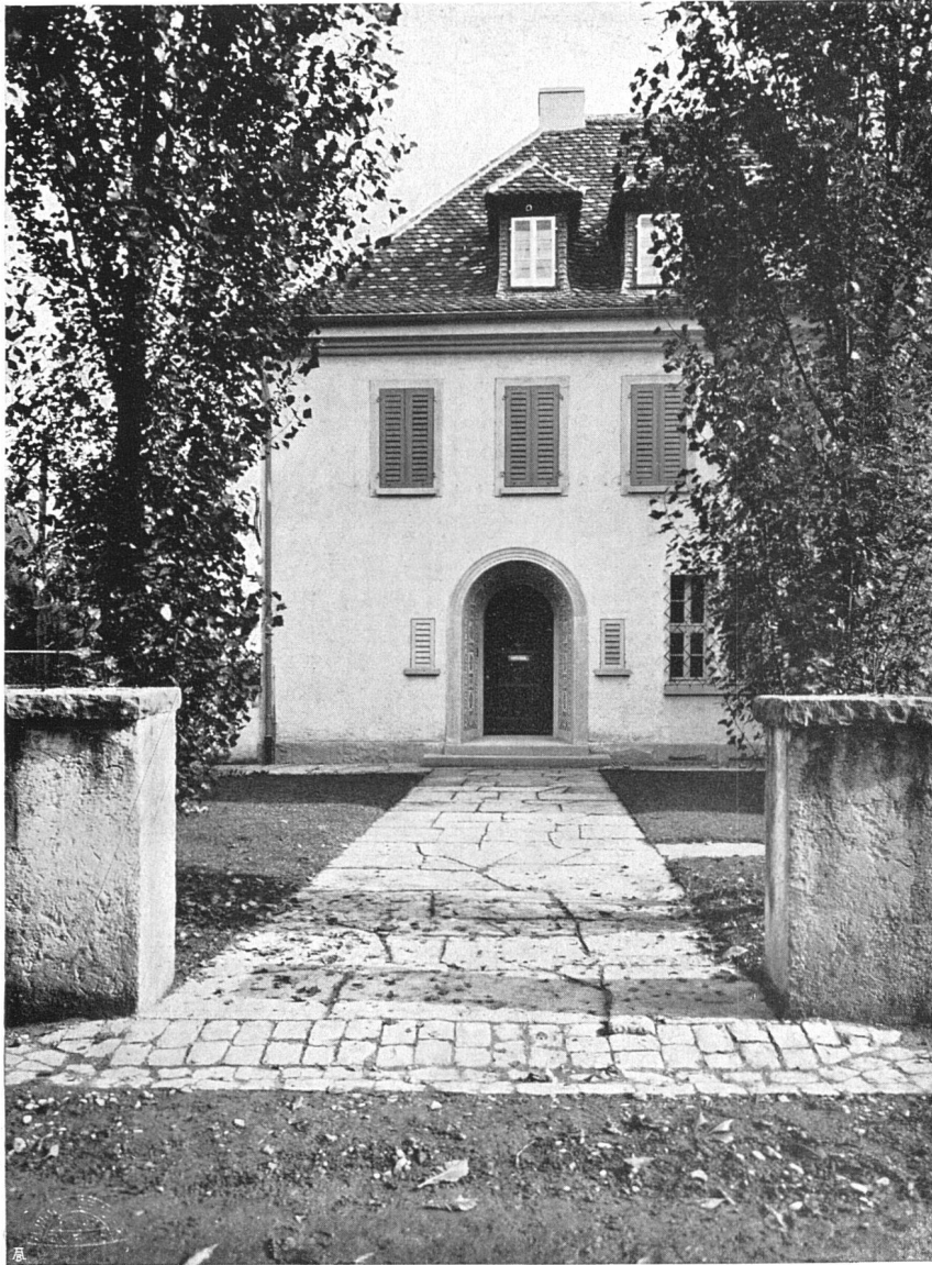
Landhaus in Rüslikon. Architekten Vogelsanger & Maurer B. S. A., Rüslikon Eingang von der Straße her

maintenant les gens du pays à ces tableaux, et la plupart ne veulent pour rien au monde s'en défaire, sentiment qui leur fait du reste le plus grand honneur.