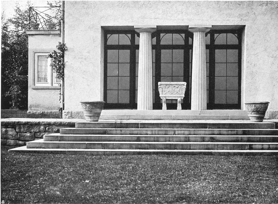
Landhaus in Rüschtikon