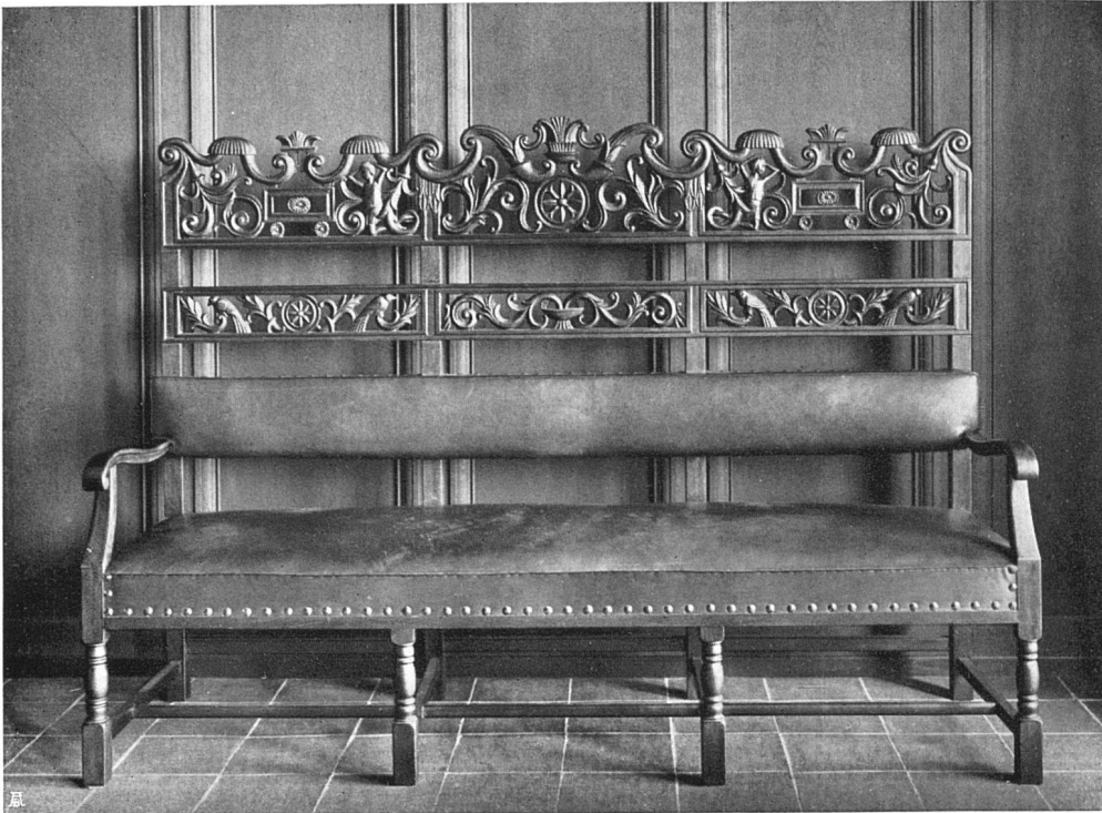
Landhaus in Rüschlikon. Bank aus dem Eßzimmer. Entwurf: Architekten Vogelsanger & Maurer modelliert von O. Münch, Bildhauer S. W. B., Zürich

in der sorgfältig erwogenen, reich verzierten Deckenaufteilung. Ein Raum, der zum Verweilen einladet am großen Ausziehtisch. Die geschnitzte Banklehne zieht sich hin als reich blitzendes Ornament hinter den Köpfen der blühend fröhlichen Gesellschaft. Die Stühle sind schwer, im Rückenpolster gut stützend und fassend, wirklich ausprobiert. In einer bedachtsamen Materialbehandlung und in einfachen Formen ist hier mit neuzeitlichen Mitteln ein Raum geschaffen worden, der in seiner Behaglichkeit an holländische Intérieurs erinnert; keineswegs in äußerlichen Stilreminiszenzen, wohl aber im tiefen Sinn einer vornehmen Gastlichkeit. Der Eintritt aus den kleinen Zimmern in den Eßraum wirkt überraschend. Eine weitere Überraschung wird dem Gast beschieden, wenn er eine Stufe höher steigt, den Vorhang zieht und in den Saal nebenan eintritt. Ein großer Raum tut sich auf, von drei hohen Wandflächen begrenzt, die im Braungrau einer