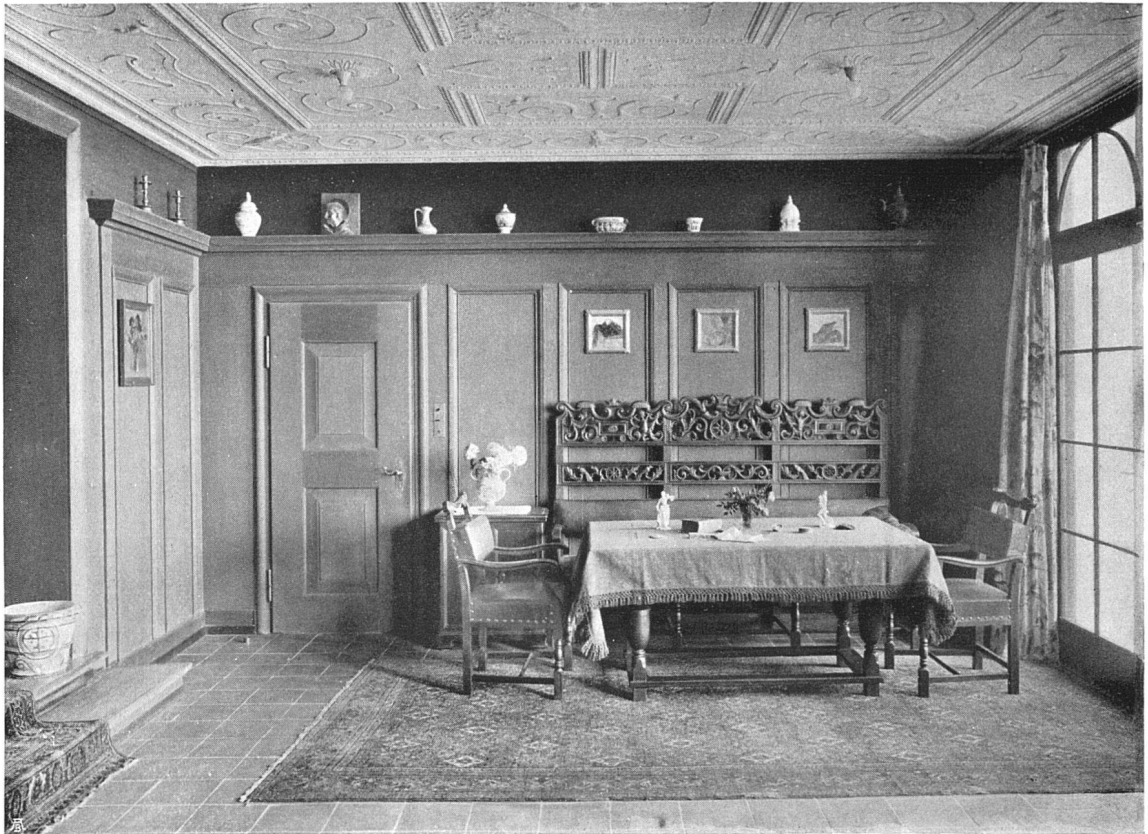
Landhaus in Rüschlikon