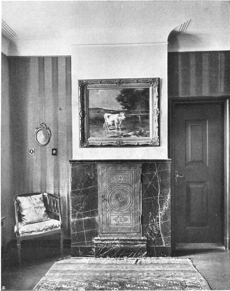
Detail aus dem Empfangszimmer des Landhauses in Rüschlikon

stückes zusammen. Ein Weg aus roh verlegten Platten führt zum Gartenhaus, zu einem einladenden Sitz; einladend vornehmlich durch die Bemalung in den Wänden. Die Illustration in diesen Seiten gibt einen unzulänglichen Eindruck wieder, da sie der Farben entbehrt, im erdig braunroten Grund, im brennenden Rot, im satten Grün und Blau der Gewänder, da die künstlerisch beste Fassung an der Eingangswand, der Flötenspieler, im photographischen Bild nicht aufgenommen werden konnte.