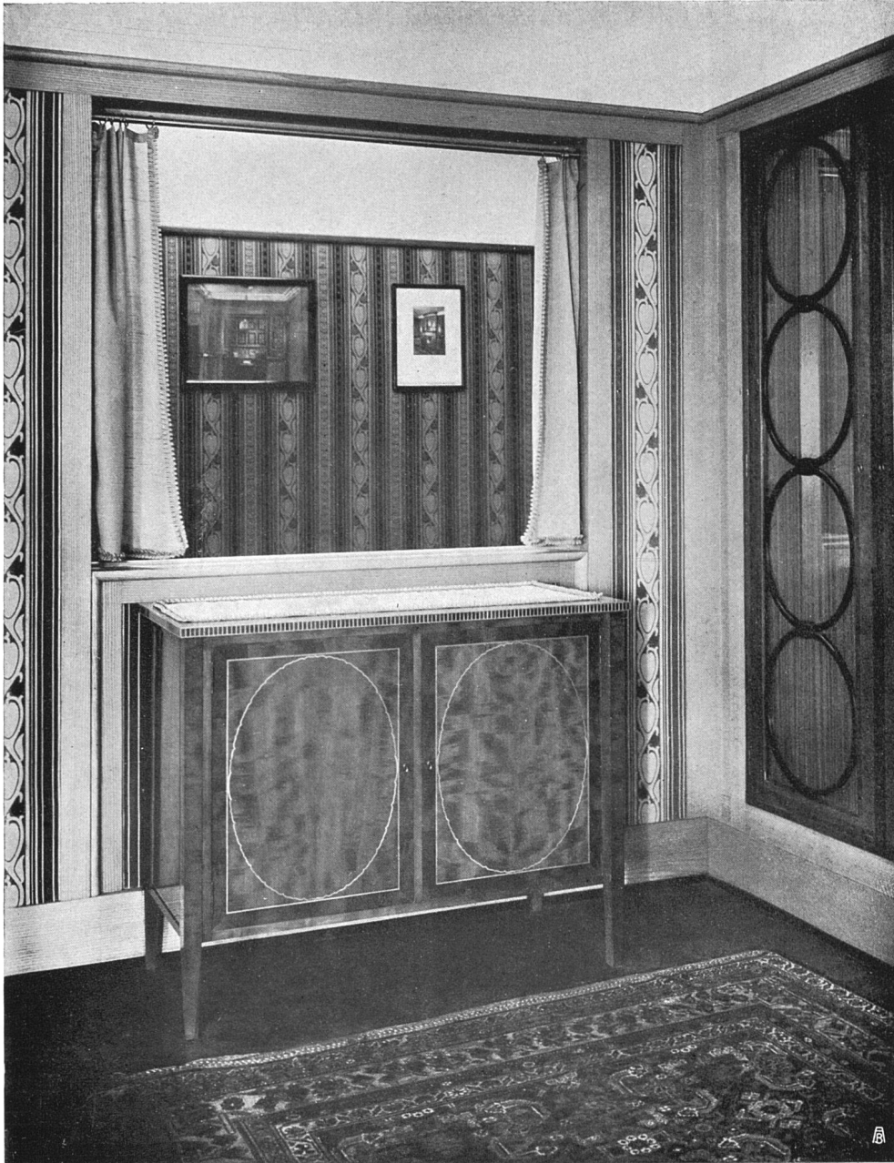
Zimmer einer Dame. Birnenholz mit Buchsbaum- und Zitronenholz-Intarsien. Entwurf: Architekt O. Ingold B. S. A., Bern. Ausführung: Hugo Wagner, Werkstätten für Innen-Einrichtung S. W. B., Bern