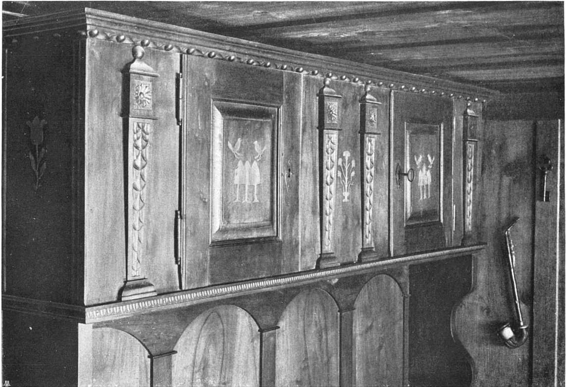
Buffet, Nußbaum mit einfachen Intarsien. Privatbesitz Meiringen

bei der Wanderlust und dem Erfindungsgeist der Bergler nicht leicht eine lückenlose Reihe von Einflüssen und Überlieferungen feststellen läßt. In einigen Gegenden verstand man früher mit vollendeter Künstlerschaft, die Möbel zu bemalen, in andern war mehr die Schnitzerei heimisch, aber häufig kreuzen sich beide, aus dem einen Grunde schon, weil man mit dem weichen und mit dem harten Holz, das einmal da war, etwas anzufangen wußte.