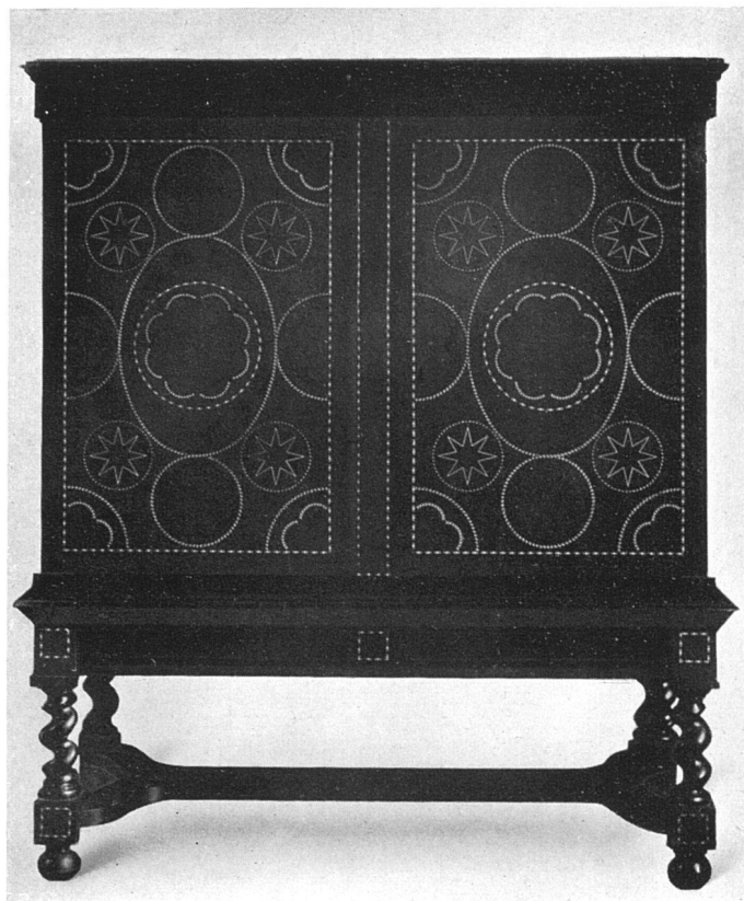
Aus Huisvaad en Binnenhuis in Neder- land. K. Sluyterman 's Gravenhage Martinus Nijhoff

nehme Hoftischler Ludwigs XIV., die Kunst gelernt, die er in seinen unerhört reichen und unnachahmlichen Stücken aus Schildpatt und Messing ins Werk setzte. Ein zweiter und letzter Aufschwung war dann der Technik beschieden, als bei fortschreitendem 18. Jahrhundert der ostindische Handel jene wundervollen Hölzer in unsern Erdteil lieferte, die nun fast jede bildmäßige Wirkung zuließen. Es war ein deutscher Tischlermeister, der damals in Paris und an allen europäischen Höfen seine Triumphe als Intarsiator feierte, kurz vor Revolution und Kaiserzeit, welche die guten Handwerker auf den Schlachtfeldern verbrauchten und nachher zusehen mußten, wie mit viel Geld, viel Stil und wenig Kunstfertigkeit noch ein ordentliches Möbel zu schaffen sei.