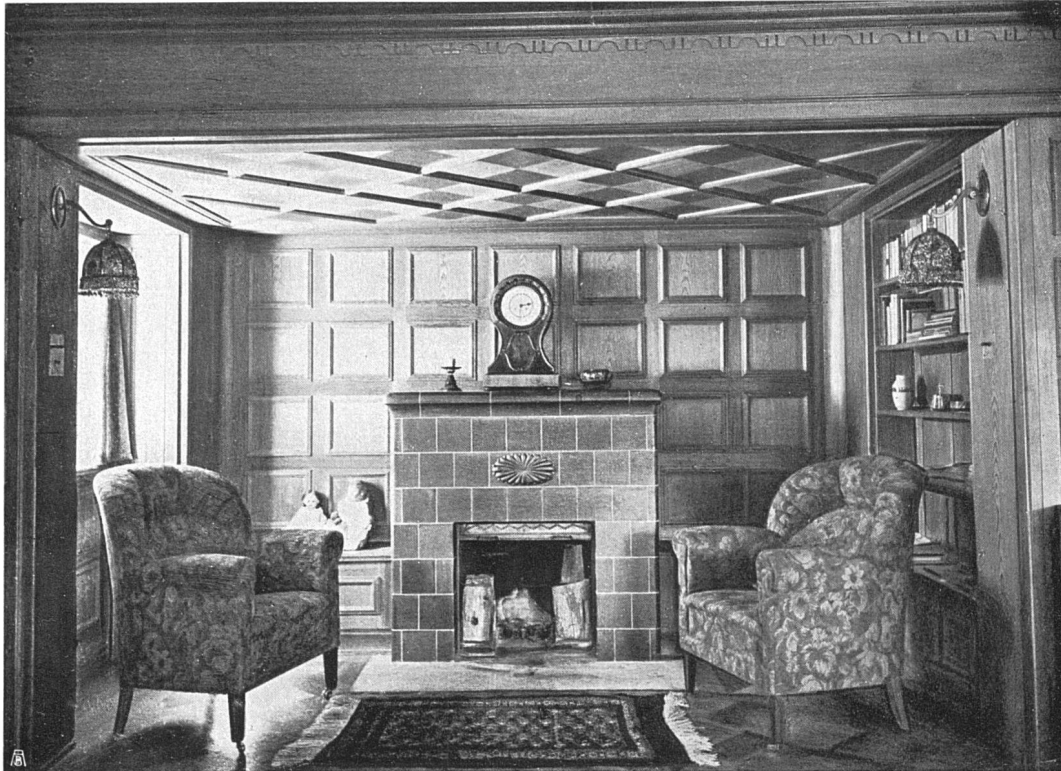
Haus Bartuns in Sils. Architekten Rittmeyer & Furrer S. W. B., Winterthur. Kamin im Wohnzimmer: Gebrüder Mantel S. W. B., Elgg. Heizung und Warmwasserbereitung: Gebrüder Sulzer Akt.-Ges., Abt. Zentralheizungen, Winterthur Unten: Grundrisse vom Erdgeschoß und vom Obergeschoß. Druckstöcke der Grundrisse aus der Schweiz. Bauzeitung