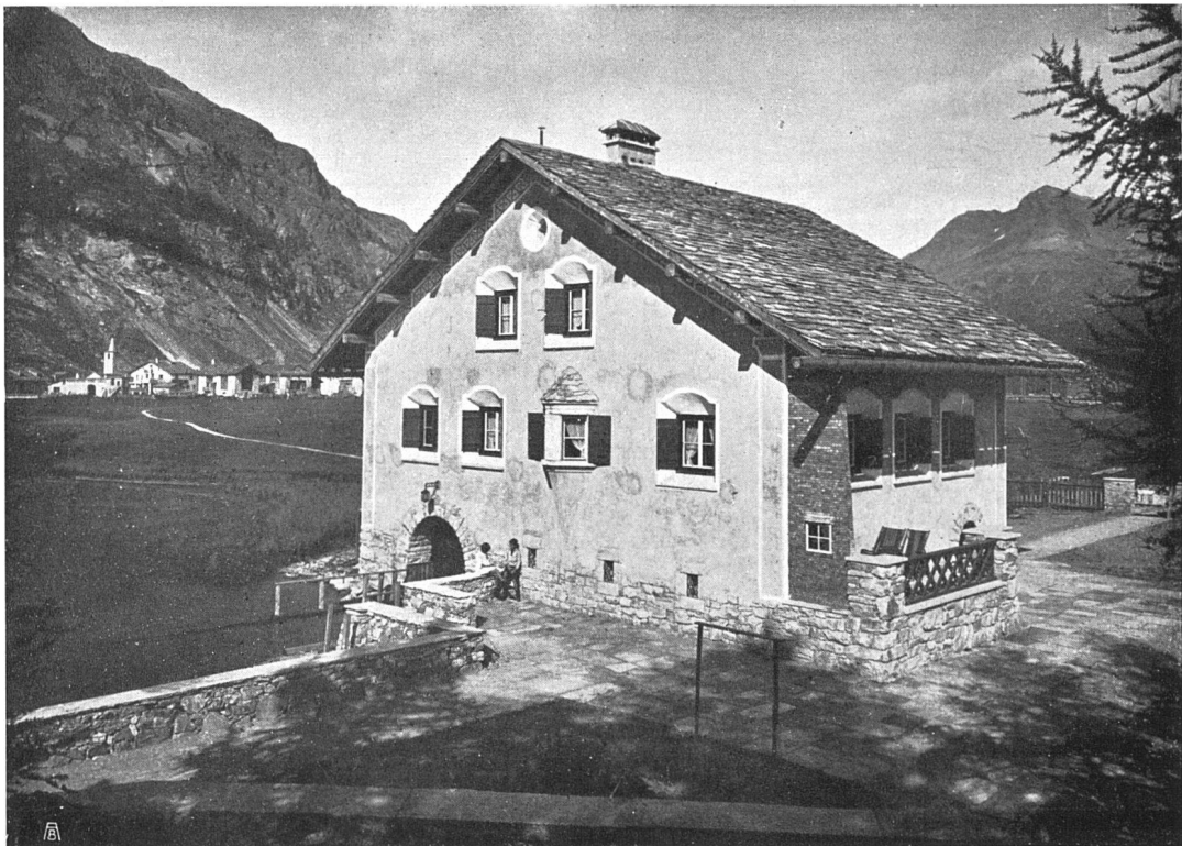
Maurer-Arbeiten und Bedachung mit Fexerplatten: H. Kuhn, Baugeschäft Sils; Granitarbeiten: A. Conrad, Granitwerke in Andeer; Glaserarbeiten: Müllers Söhne, mech. Bauglaserei Glarus; Wand- und Bodenbelag: A. W. Graf, Winterthur