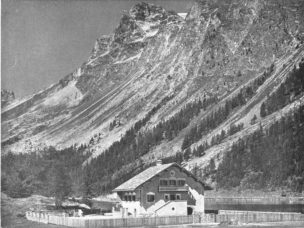
Haus Bartuns in Sils

Architekten Rittmeyer & Furrer S.W. B., Winterthur