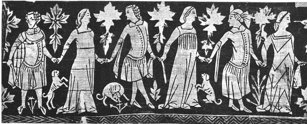
Die Tapete von Sitten