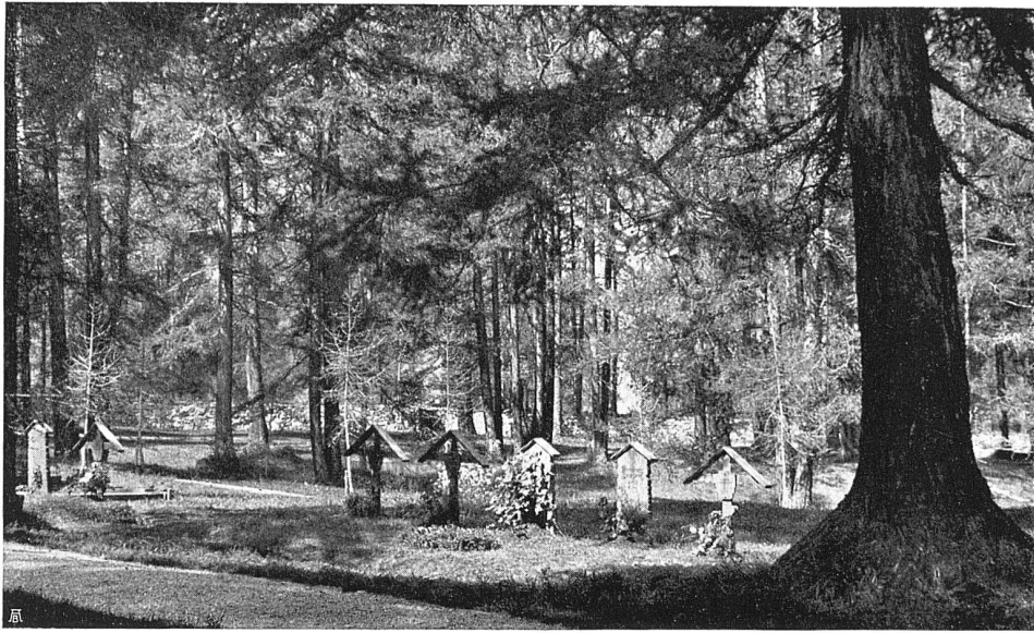
Waldfriedhof Davos, Reihengräber im allgemeinen Feld

eignetste für eine Hochgebirgs-Waldfriedhofanlage. So wurde das bestehende ovale freie Feld durch eine Längs- und Querachse geteilt, mit Längs- und Querwegen umschlossen und dicht mit Reihengräbern belegt. Die Mitte desselben schmückt ein einfaches Wasserbecken. Aus dem Oval führt die Querachse nach dem im Südwesten befindlichen Haupteingang, während die Längsachse südöstlich nach dem Waldfriedhof mit Ausblick nach dem Sertigtal und nordwestlich nach dem Nebeneingang hin orientiert. Zwischen dem Haupteingang und dem ovalen Feld ist ein Teil eingeschoben, welcher in seiner Belegung von der freien Waldanlage zum dicht besetzten Feld überleitet. Die eigentliche Waldanlage umschließt somit auf drei Seiten das Totenfeld und gewährt über den Wildboden hin talauf, talabwärts und nach Sertig wundervolle Ausblicke. Der Haupteingang mit ovaler Wagenumfahrt wurde mit Rücksicht auf die kürzeste Straßenverbindung mit der Rhätischen Bahn (Haltestelle) und Kantonsstraße an vorerwähnter Stelle angelegt; ihm gegenüber, zu einer Platzanlage vereinigt, die niedere Leichenhalle samt dem höhern Verwalterhaus, und daran anschließend, durch Baumbestand lose verbunden, ist eine stimmungsvolle