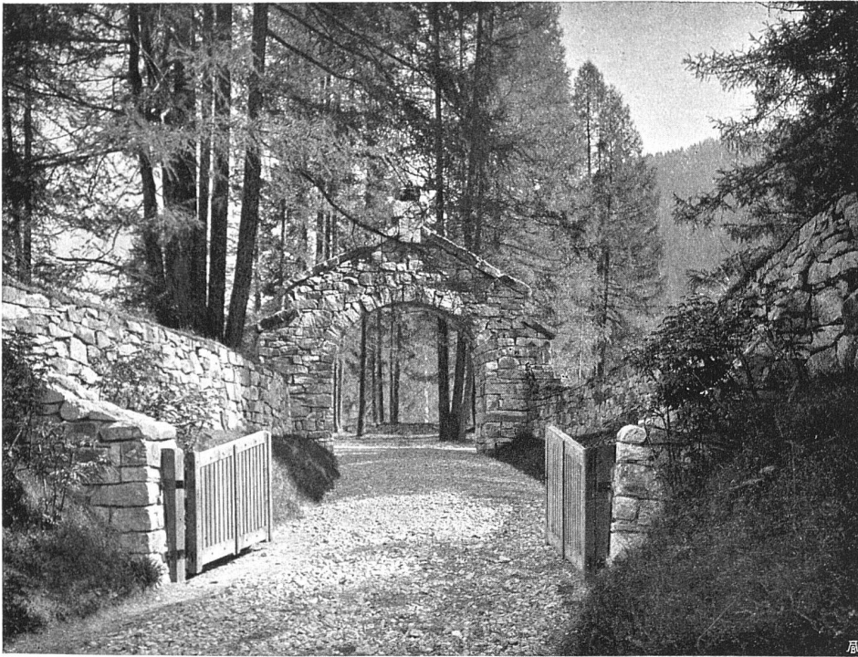
Haupteingang II, Vorderansicht. Unten: Nebeneingang für Fußgänger

Individualfriedhofes wurde bisher erreicht im Waldfriedhof, wie er in neuerer Zeit immer mehr angestrebt wird — nach unserem Dafürhalten unrichtigerweise auch für die Großstadt, wo er keine Berechtigung hat — und eine der glücklichsten Lösungen, wobei allerdings auch die Natur in seltener Weise der Idee entgegengekommen ist, den neuen Waldfriedhof auf dem Wildboden bei Davos können wir hier in einigen Bildern vor Augen führen. Architekt B.S.A. Rudolf Gaberel in Davos ließ sich bei der Ausgestaltung seiner Aufgabe von dem Gedanken lei-