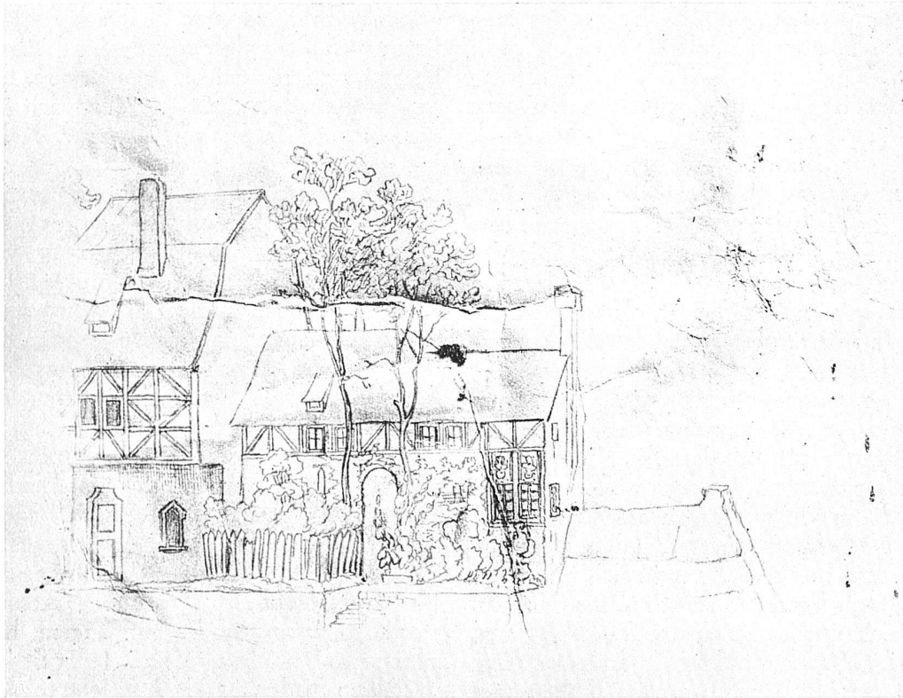
Gottfried Keller, Karton einer mittelalterlichen Stadt