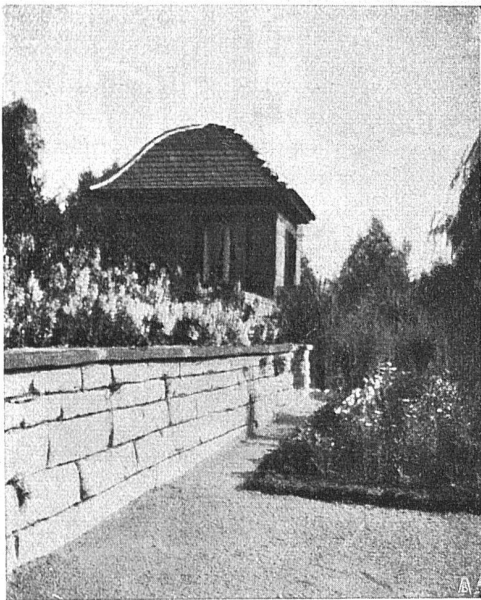
A. Bodmer, Zürich-Wollishofen Gartenbau

A. & R. Wiedemar, Bern Spezialfabrik für Kassen- und Tresor-Bau Bestbewährte Systeme, moderne Einrichtungen Gegr. 1862 / Goldene Medaille S. L. A. B. 1914 / Gegr. 1862