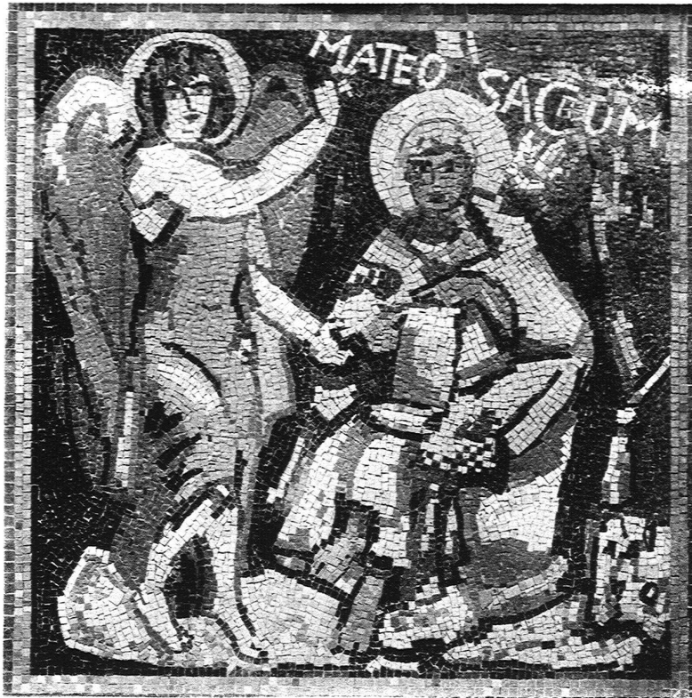
ABB. 22 ALEXANDRE CINGRIA, MOSAÏQUE