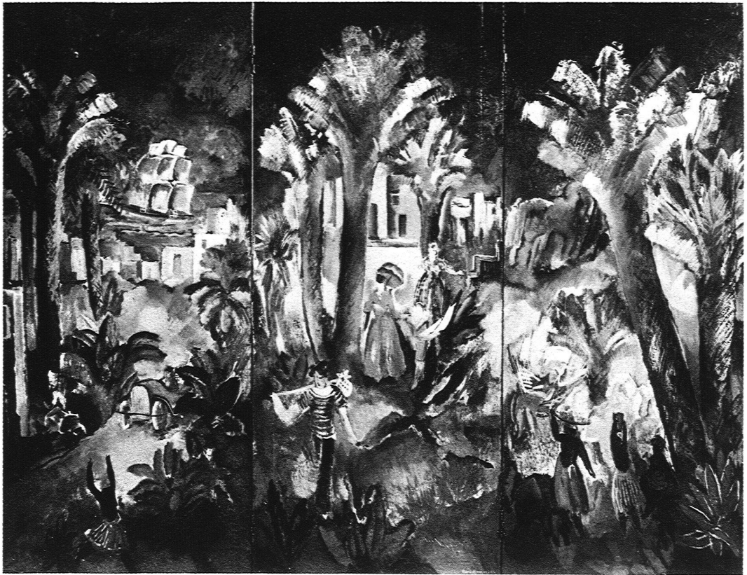
ABB. 24 RAOUL DOMENJOZ, PARAVENT