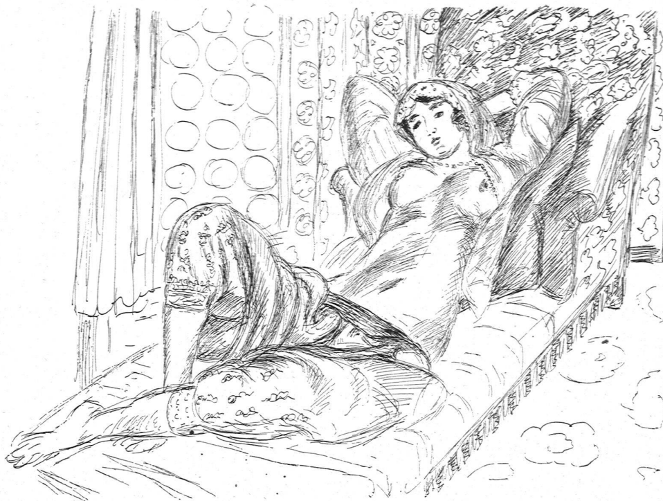
HENRY MATISSE, L'ORIENTALE AUS DER „MAPPE DER GEGENWART“

Es sei bei diesem Anlass daran erinnert, dass die Marées-Gesellschaft seit vier Jahren die kunstliebenden Kreise mit einem Jahrbuch erfreut, das nach dem letzten grossen Gemälde ihres Patrons Hans von Marées den Namen « Ganymed » führt. 1919 erschien der erste Band in Form eines kleinen, hübschen Buches. Seit 1921 steht dieses Jahrbuch unter der klugen und temperamentvollen Leitung von Wilhelm Hausenstein , und mit ihm setzt der Verlag R. Piper & Co. in München alles daran, dieses «Jahrbuch für die Kunst», wie sein Untertitel lautet, zu einer wahren Revue alles geistigen Schaffens in Europa auszubauen. Das kleine Oktav-Format hat längst einem grössern Quart Platz gemacht, neuerdings wird den allzu Verwöhnten noch eine Mappe mit originaler Graphik dazu geboten, und vor allem sind neben die Aufsätze über bildende Kunst gleichwertige Beiträge zur modernen Dichtung, zur Musik, zum «gesellschaftlichen Leben» u. a. m. getreten, und in der Rubrik der «Paralipomena» sprechen sich die Mitarbeiter über Fragen der heutigen Kunstpolitik, des Ausstellungswesens u. a. aus. Die periodischen Nachrichten über die Tätigkeit und die Pläne der Marées-Gesellschaft dokumentieren den Zusammenhang mit dieser und ihrem Leiter, Julius Meier-Graefe . Gtr.