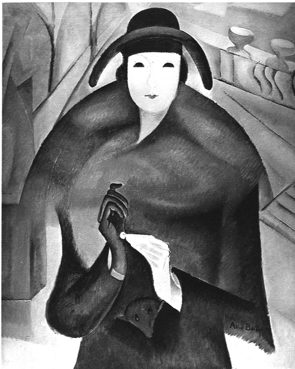
ABB. 21 ALICE BAILLY, MATIN FRILEUX AU LUXEMBOURG COLLECTION G. R., WINTERTHOUR

collines ou vers Dieu. Tandis qu'Alexandre Cingria, seul à la brèche, comme si l'Eglise n'avait que lui, gonflé de véhémence baroque, amalgamant la Légende dorée et les idoles de la modernité, rallume aux verrières la féerie de Rome et rebrosse avec un fa presto terrible les fastes de l'Eglise militante. La Rome protestante n'est pas une école de féerie, mais elle forme à l'examen, à l'exploration des faits jusqu'à ce désenchantement radical où la platitude du fait n'effarouche plus. Pôle hygiénique où l'artiste de caractère touche au moins une fois, et où il trouve Félix Vallotton définitivement installé. Lieu des certitudes sans délectation. D'un fait de nature quelconque faire un fait de peinture, l'inconnue charme étant exclue de l'équation, ainsi posé le problème de la peinture prend un aspect de chimie ou d'algèbre. Dès ce moment elle n'emprunte plus rien aux arts voisins, aux muses d'à côté, dédaigne les références de beauté, l'esprit, la touche. La chose peinte prend cette