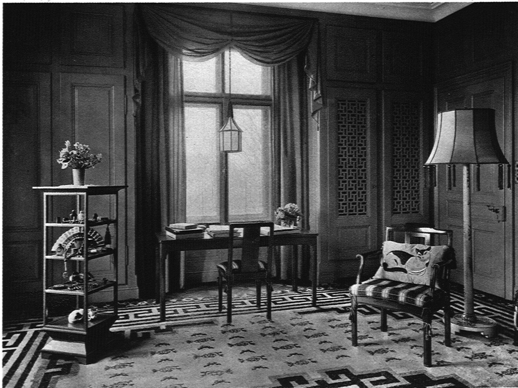
ABB. 13 WOHNZIMMER Möbel aus rotem Lack, altes Wandgetäfer in jadegrünem Lack, Vorhänge in blauer Seide, alter Shantung-Teppich