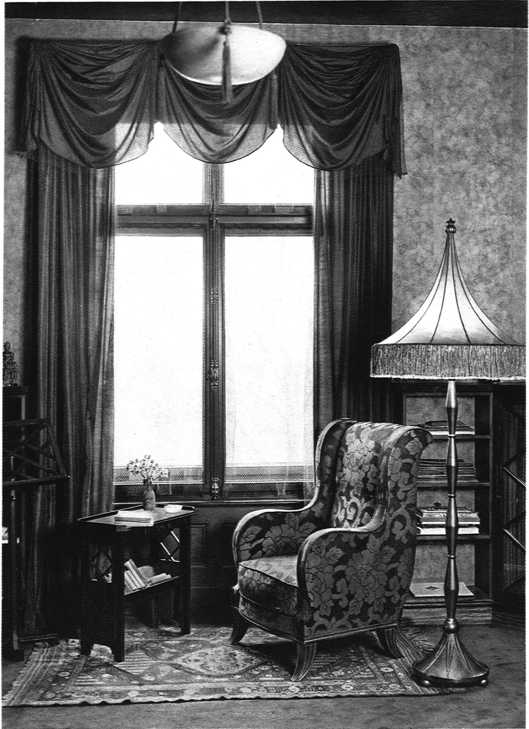
ABB. 11 BIBLIOTHEK Lehnsessel aus schwarzem Seidenbrokat mit golddurchwirktem Muster; Stehlampe aus vergoldetem Holz, Lampenschirm in meergrüner, Vorhänge in rotbrauner Seide