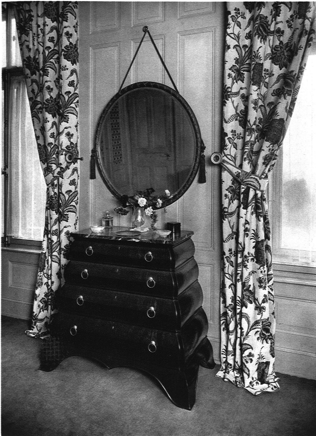
ABB. 15 SCHLAFZIMMER Kommode aus ostindischem Palisander, Vorhänge in Toile de Souy