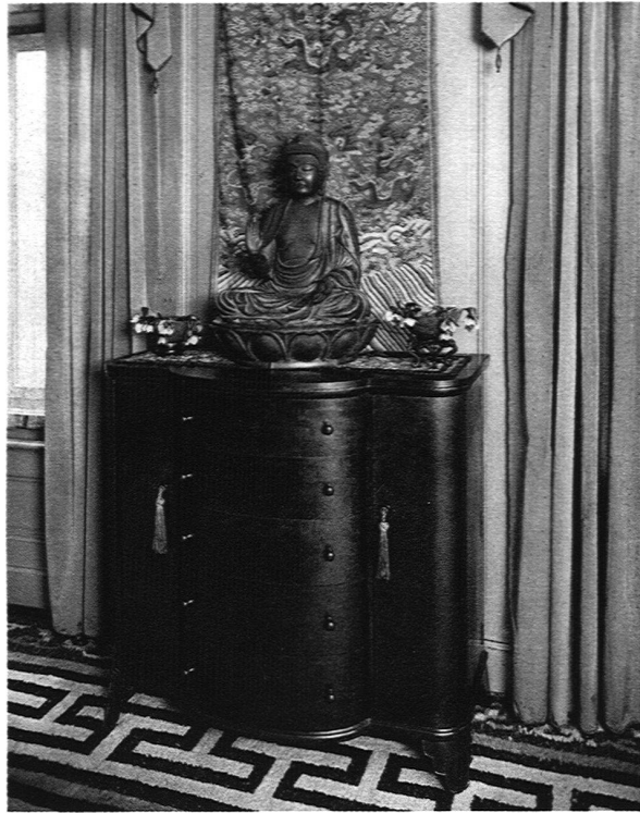
ABB. 12 WOHNZIMMER Kommode aus Padoukmaser, ausgeführt von J. Vorhoff, Genf