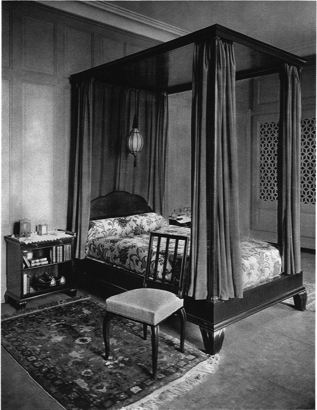
ABB. 14 SCHLAFZIMMER Himmelbett aus ostindischem Palisander, Decke aus Rosenholz, Bettvorhänge in kirschroter Seide Ausführung durch Toso und Badel, Genf