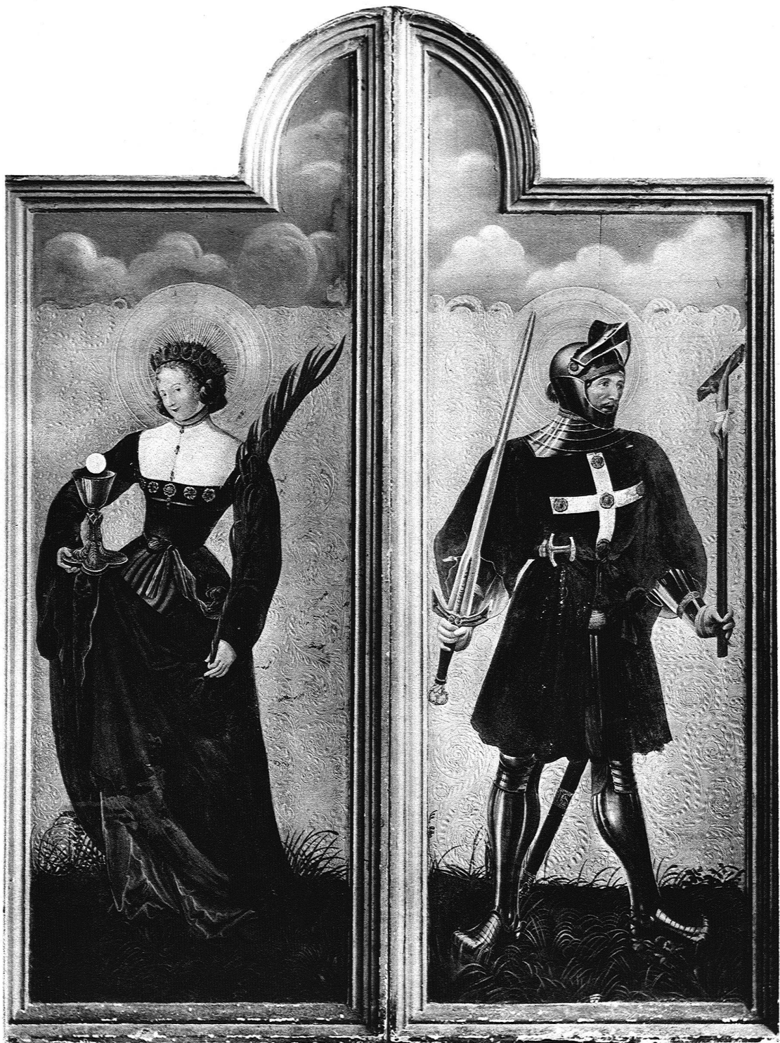
A B B. 24 NIKLAUS MANUEL (1484—1530) DIE HEILIGEN BARBARA UND ACHATIUS INNENSEITEN DES EHEMALIGEN ALTARS DER FRANZISKANERKIRCHE IN GRANDSON VON 1516 PRIVATBESITZ