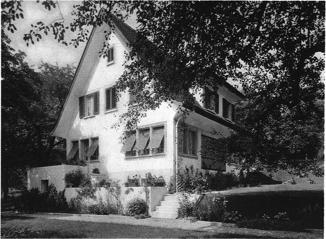
A B B. 19 HERMANN FIETZ, ARCHITEKT, ZOLLIKON HAUS NABHOLZ, ZOLLIKON GESAMTANSICHT Phot. H. Wolf-Bender

höchsten Häuser in der Mitte, die niedrigsten am Rande der Stadt stehen sollen. Hier möchte man vor allem wünschen, dass die wohldurchdachte Theorie sich bald in dynamische Wirklichkeit umsetzen liesse.