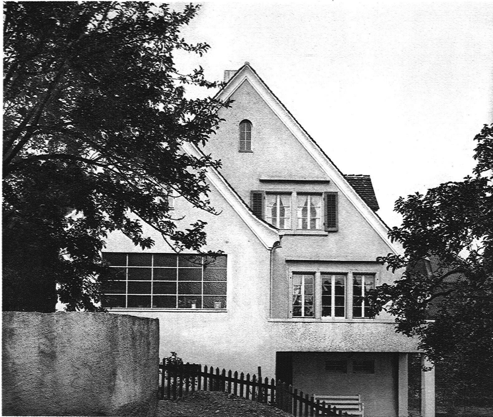
ABB. 17 HAUS THOMANN ANSICHT VON DER SEITE

durchzudenken. Er entwarf einen grosszügigen, allgemeinen Plan einer Stadterweiterung, der dem jetzigen Köln von 700 000 Einwohnern die bequeme und organische Entwicklung zu einer dreifachen Vergrößerung sichern sollte: es handelte sich vorläufig um eine reine Theorie, aber der Städtebauarchitekt muss nicht weniger als der Naturwissenschaftler mit Hypothesen arbeiten können, um erfolgreich und fruchtbar zu arbeiten. In einer umfangreichen, alle Fragen und Einzelheiten berücksichtigenden Studie hat Schuhmacher sein «Wunschbild» des zukünftigen Köln dargestellt und wissenschaftlich-statistisch begründet. Obwohl von Köln ausgehend und für Köln berechnet, hat sein Buch allgemeine Bedeutung, und es wäre nur zu wünschen, dass alle Großstädte sich ihre Zukunft von fachkundiger Seite zur rechten Zeit vorhalten liessen. (Köln. Entwicklungsfragen einer Großstadt von Fritz Schumacher. Saaleck-Verlag, Köln 1923.)