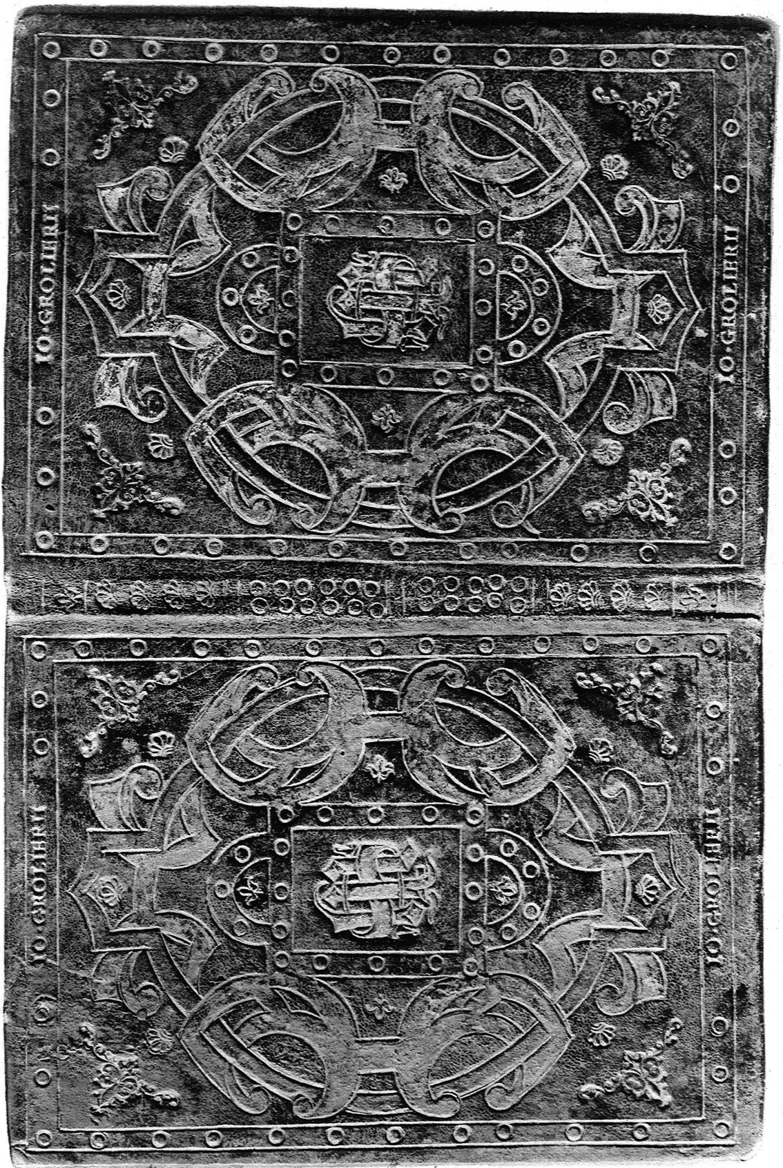
Abb. 26 Einband für Jean Grolier im Besitz des Gewerbemuseums in Winterthur