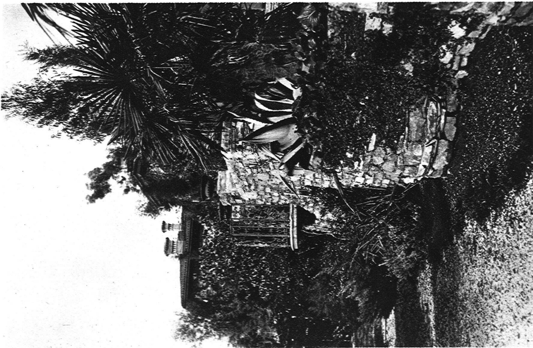
ABB. 12 BLICK GEGEN DIE KANZEL ÜBER DEM UNTERN TEIL DES GARTENS AUSFÜHRUNG: FROEBEL, GARTENARCHITEKTEN S. W. B., ZÜRICH Auf der mit Ficus repens überspannten Mauer eine grosse Agave. Unterhalb der Mauer Veronica und Tritomen