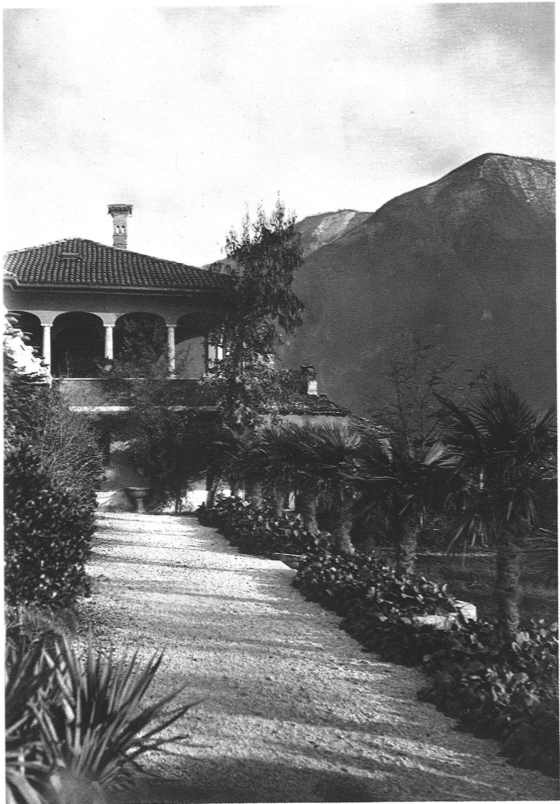
ABB. 10 BLICK GEGEN DAS NEBENGEBÄUDE AUSFÜHRUNG: FROEBEL, GARTENARCHITEKTEN S. W. B., ZÜRICH Im Hintergrund neben dem Brunnen eine Mimose, an der Ecke ein Eucalyptus