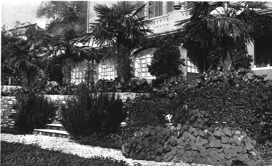
ABB. 11 BLICK AUF DIE RAMPE VOR DEM HAUS AUSFÜHRUNG: FROEBEL, GARTENARCHITEKTEN S. W. B., ZÜRICH An der Fassade Rosen und Glyzinen, davor Granat- und Lorbeerbäume; an der vordern Mauer Ficus repens

egangenen Weg, der nach Gandria führt. Vom Garten aus, der seewärts gegen den Verisio fällt, schweift der Blick am steil aufragenden Salvatore vorbei bis hinunter nach Melide. Auf Grund von Plänen der Architekten Pflughard & Haefeli wurde das Haus von Architekt Hafner in Lugano vereint mit Architekt Fritz Berner in Zürich erstellt. Vor Beginn der Bauarbeiten ist dem Garten alle Aufmerksamkeit geschenkt worden. Die Studien und Pläne wurden von den Gartenarchitekten Froebel in Zürich gemacht, denen dann auch die Ausführung übertragen wurde. Zu Beginn des Jahres 1921 konnten die Vorarbeiten rechtzeitig eingeleitet werden, dass es noch möglich war, die Anpflanzung fertigzustellen.