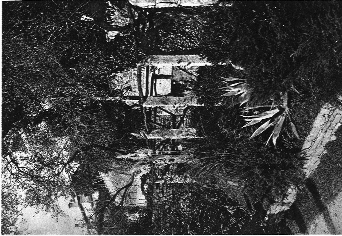
ABB. 13 DIE PERGOIA AN DER STRASSE AUSFÜHRUNG: FROEBEL, GARTENARCHITEKTEN S. W. B., ZÜRICH Agaven, Pampasgras und Stochginster