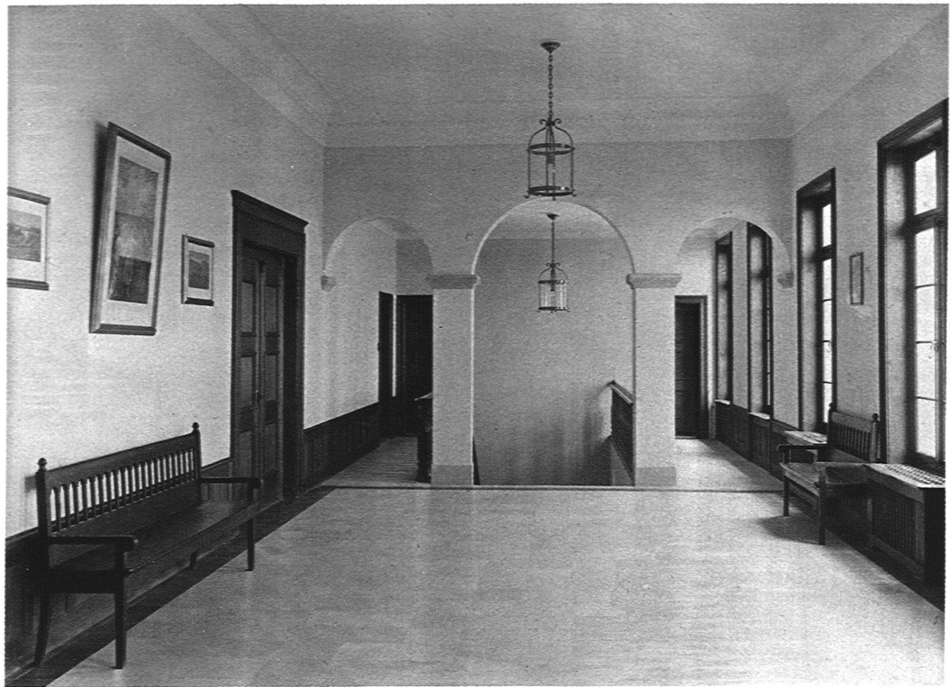
ABB. 16 HALLE IM I. STOCKWERK