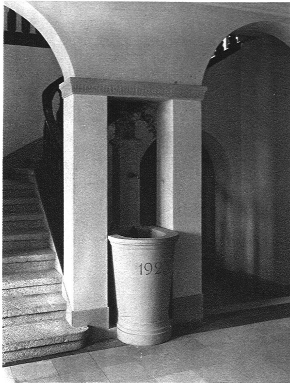
ABB. 17 BRUNNEN IM PARTERRE

kann. Auf den Hochbarock der römischen Päpste (zirka 1550—1650) folgt der Spätbarock des französischen Königtums; der Stil von Versailles wird verbindlich für ganz Europa während eines vollen Jahrhunderts. Wollte man eine solche Einheit bis zur Evidenz beweisen, so müsste man freilich über die Grenzen der profanen Schlossarchitektur hinausgehen und nicht nur die gesamte Baukunst, sondern die gesamten Künste und das ganze geistige Leben des Jahrhunderts in Betracht ziehen. Wenn eine solche Arbeit über die Kraft des einzelnen Gelehrten geht, so bleibt es umsomehr das Verdienst Hans Roses, die grosse Aufgabe überhaupt zur Diskussion gestellt zu haben, ein Verdienst, das auch durch die eventuelle schliessliche Erkenntnis, dass ein solcher Stilbegriff «Spätbarock» nicht aufrecht zu erhalten ist, nicht beeinträchtigt würde.