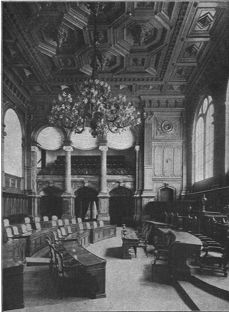
Ständeratssaal im Parlamentsgebäude in Bern

ATELIER FÜR AUSFÜHRUNG FEINER MÖBEL UND INNENAUSBAUTEN BUREAU-MÖBEL