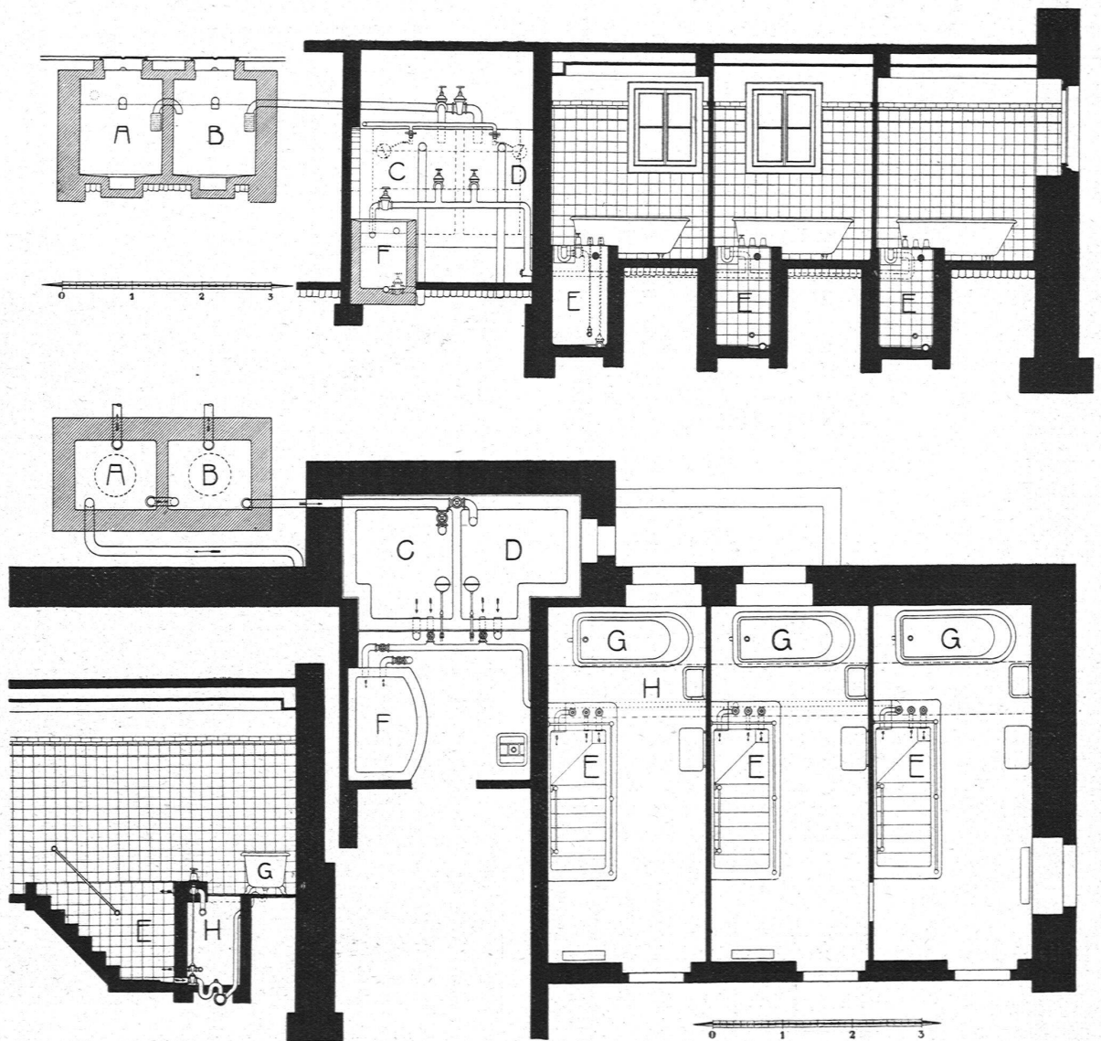
Abb. 2. Längs- und Querschnitt, sowie Grundriss der Tauchbadanlage in der Synagoge an der Freigutstrasse, Zürich 2. A Erstes äusseres Betonreservoir C Erstes inneres Regenwasserreservoir E Tauchbäder G Wanne B Zweites " " D Zweites " " F Tawelbassin H Begehbare Kanal

sowie den Regen- und Warmwasserzufluss werden mittels Steckschlüssel durch die Wärterin von den Badezellen aus bedient. Die Zu- und Ableitungen, letztere mit den nötigen Geruchverschlüssen versehen, sind in einem begehbaren Kanal H untergebracht und durch Abheben von Deckeln von jeder Badezelle aus zugänglich und kontrollierbar. Sämtliche für die Regenwasseranlage und Tauchbäder verwendeten Ventile und sonstigen Armaturen mussten aus rituellen Gründen nach neuen Modellen und in neuem Rohmaterial für diesen Zweck besonders hergestellt werden. Es ist denn auch alles sehr solid und, den besonderen Zwecken entsprechend, gediegen aus-