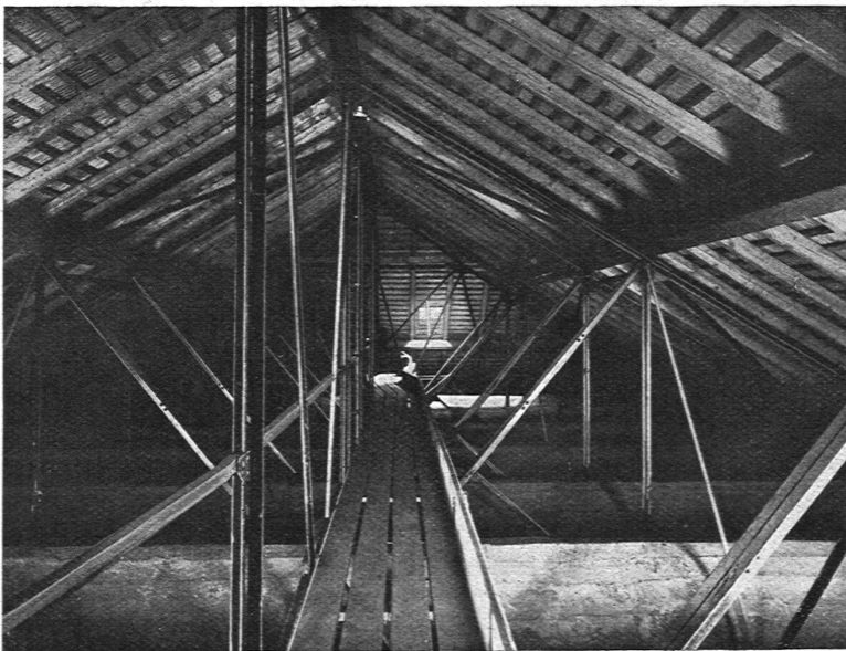
Abb. 3. Blick in den Dachraum über der Synagoge. (Ausführung der Eisenkonstruktion durch die Firma Löhle & Kern A. G., Zürich.)

Die sanitären Installationen sind ausgeführt von E. O. Knecht, Ingenieur, Zürich 8; die Heizung und Warmwasserbereitung von Gebr. Sulzer A. G., Zürich und Winterthur.