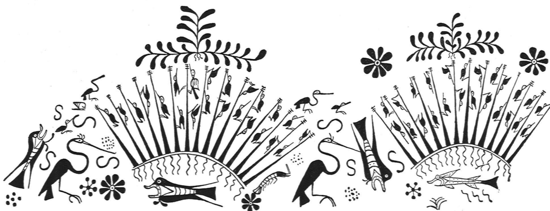
ZEICHNUNG AUF EINEM TONGEFÄSS AUS NORDPERU