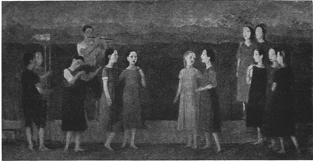
WALTER CLÉNIN, WABERN / ENTWURF FÜR EIN WANDBILD