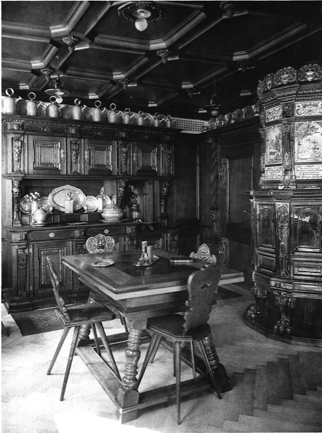
STUBE IN RENAISSANCE-STIL IN ZUG J. KELLER & CIE., MÖBELFABRIK, ZÜRICH