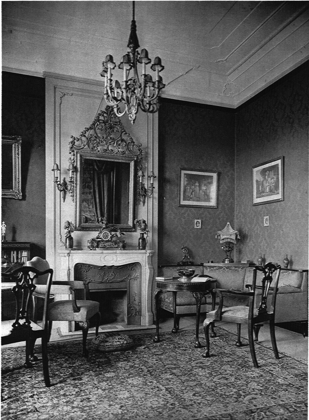
SALON IN EINER VILLA IN ZÜRICH J. KELLER & CIE., MÖBELFABRIK, ZÜRICH