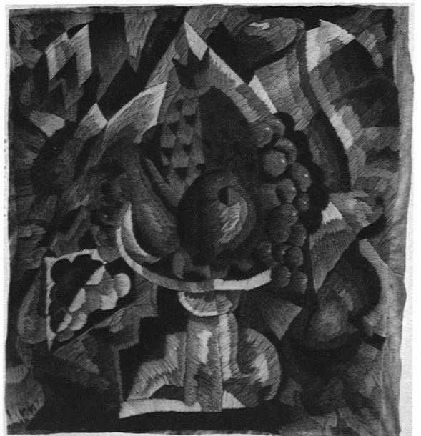
VINCENT-VINCENT, LAUSANNE-NEUCHÂTEL NATURE MORTE Coussin brodé en laine

La cité — le centre — se composera de vingt-quatre gratte-ciels réservés aux bureaux, hôtels, etc. . . et pouvant contenir de 400,000 à 600,000 habitants. A l'entour s'élèveront les maisons d'habitation avec façades à re-dents et séparés par de grands terrains aménagés de façon à ce qu'on puisse faire du sport à sa porte.