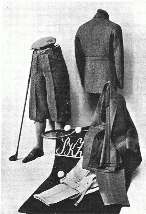
BURGER-KEHL & CO., ZÜRICH PKZ-Schau fenster